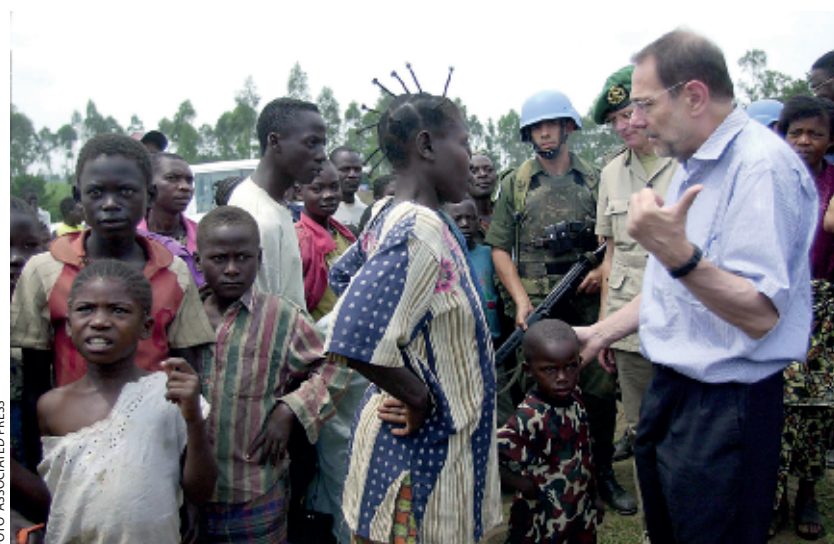
Operatie Artemis in Congo was de eerste autonome militaire EU-missie en geldt als een voorloper van de EUBG

Vanaf 2003 streefde de EU naar een actiever beleid op het gebied van conflictpreventie. Dit resulteerde in meer dan vijftien civiele en vijf militaire vredesmissies. 35 Op verzoek van de toenmalige secretaris-generaal van de VN, Kofi Annan, startte Operatie Artemis in juni 2003 met als doel de veiligheid in delen van Congo te stabiliseren. Dit was de eerste autonome militaire EU-missie, zonder betrokkenheid van de NAVO en de eerste operatie die plaatsvond buiten de Europese Unie en onder hoofdstuk VII van het VN Handvest. 36 Hoewel de operatie algemeen geroemd wordt als eerste inzet van een voorloper van de EUBG, werd zij vooral gedomineerd door Frankrijk, dat wilde laten zien dat de EU onafhankelijk van de NAVO kon optreden. 37 De operatie toonde aan dat de Europese Unie militair en politiek gezien succesvol kon zijn met een snelle interventie-macht, ver van huis en kon samenwerken met regionale organisaties. Daarnaast gaf de