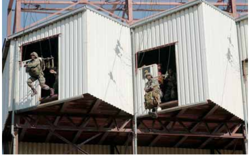
Para-opleiding bij de SANDF

Zuid-Afrika speelde vervolgens een leidende rol bij de totstandkoming van de African Nuclear Weapons Free