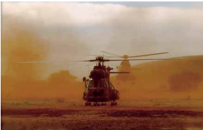
Super Puma-helicopters

is verbonden. Dit om de raciale diversiteit in de hoogste rangen te verbeteren. 19