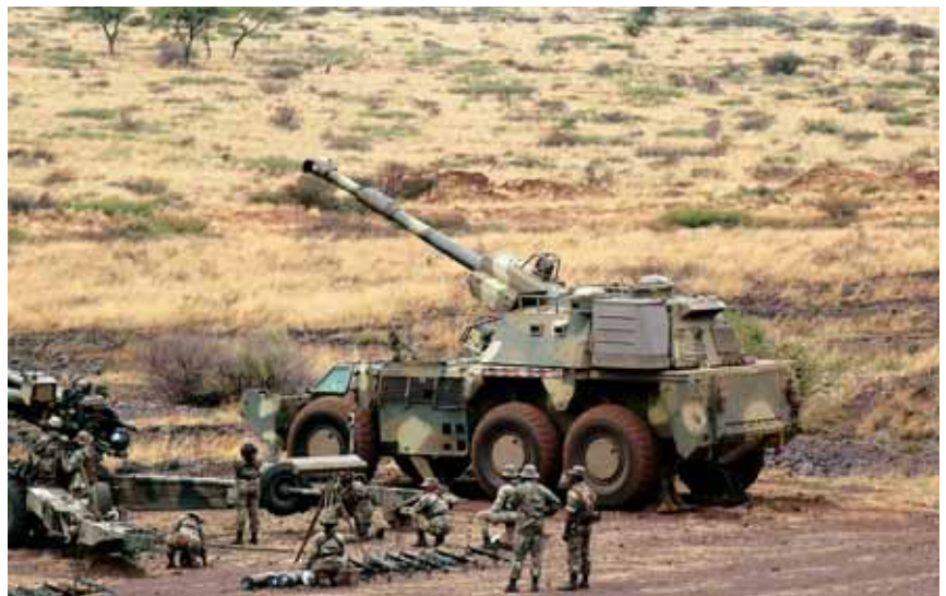
G6 155 mm veldgeschut

Tegen het eind van de jaren tachtig beschikte Zuid-Afrika over een substantiële defensie-industrie, die producten en uitrusting maakte die ontwikkeld waren om in het moeilijke terrein in de regio te gebruiken. De defensie-industrie wist een verscheidenheid aan geavanceerde wapensystemen, zoals gevechtsvliegtuigen, helikopters, raketten, pantservoertuigen en oorlogsschepen te produceren. Zuid-Afrika werd toen tevens een belangrijke wapenexporteur.