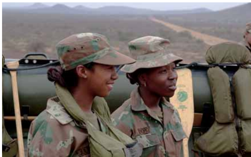
De SANDF telt ruim 17.000 vrouwen

Zowel het White Paper als de Defence Review was uitgesproken over de rol van de SANDF op het gebied van interne veiligheid. Alleen onder zeer uitzonderlijke omstandigheden, wanneer de politie over onvoldoende