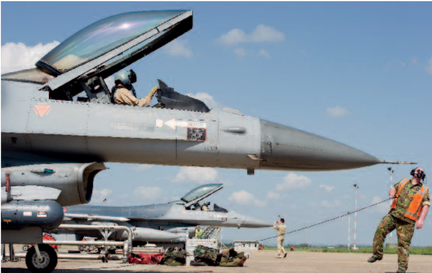
Nederlandse F-16's tijdens voorbereidingen voor trainingsvluchten op Sardinië: Unified Protector ging direct de Europese belangen aan, maar niet alle NAVO-landen daar waren bereid offensieve middelen te leveren