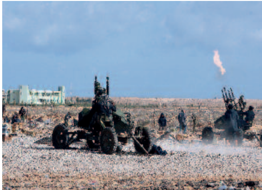
Special Forces onderhielden de verbinding met de rebellen, die onder meer probeerden veroverde vliegvelden te verdedigen tegen de luchtmacht van Gaddafi

Verenigde Arabische Emiraten de operatie met SF-eenheden ondersteund. 60 Deze eenheden trainden rebellen in het lokaliseren en identificeren van eenheden die trouw waren aan het Gaddafi-regime, zodat luchtsteun gericht kon worden ingezet. Ook verzorgden SF-eenheden de verbinding tussen de rebellen en de CAOC's voor Odyssey Dawn en Unified Protector. 61 Daarnaast zijn SF betrokken geweest bij de coördinatie van NAVO-luchtaanvalen tegen Gaddafi-eenheden en de operaties in onder meer Tripoli. 62 Daarbij werd onder meer gebruik gemaakt van Twitter en e-mail. 63 Vooral de liaisonofficier van Qatar in JFC Napels schijnt een actieve rol te hebben ge-