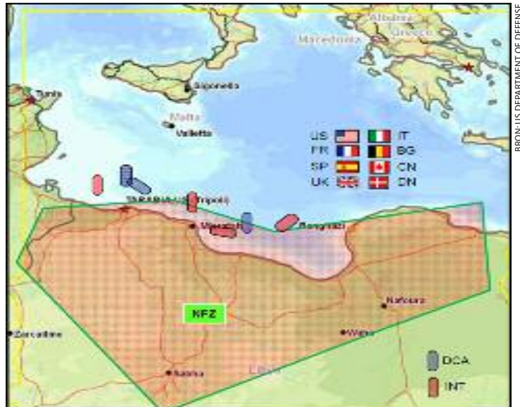
Figuur 1 De Area of Responsibility van Odyssey Dawn