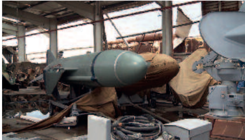
Bij acties van NAVO-vliegtuigen waren Libische wapensystemen- en opslagplaatsen voortdurend doelwit

Figuur 2 op pagina 226 geeft aan in welke delen van Libië het regime van Gaddafi een bedreiging vormde. Om in staat te zijn de grootste luchtdreiging van het Libische leger uit te schakelen, zijn tijdens de eerste aanvalsgolven veel kruisraketten en enkele B2-stealthbommenwerpers gebruikt. De B2-stealthbommenwerpers zijn door hun vorm in combinatie met de gebruikte materialen minder zichtbaar voor de radar van geleidewapensystemen en hierdoor zijn ze bijzonder geschikt om in die fase van het conflict waarbij er nog een substantiële dreiging van SAM's is, de meest kritische doelen aan te vallen.