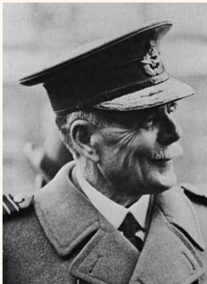
Hugh Trenchard

Dank u. Tussen haakjes, ik sta bij veel mensen bekend om, wat zij noemen, 'mijn notoir slechte bekwaamheid tot schrijven en spreken in het openbaar'. Ik beken dat dit weleens waar zou kunnen zijn. U moet er daarom maar aan wennen dat ik onderwerpen 'recht voor zijn raap' en soms zelfs onbehouwen benader.