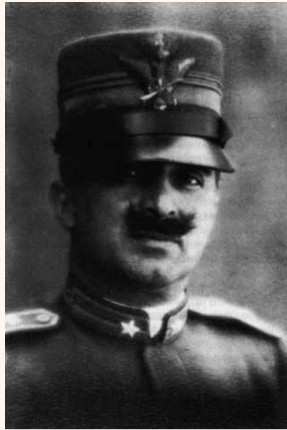
Giulio Douhet

Omdat airpower de lucht gebruikt als dimensie kan het overal opereren, op elke afstand, op elk moment en zonder enige verstoring door grenzen en met nauwelijks vijandelijk verweer. Dat is ook wat het belangrijkste voordeel bepaalt van luchtstrijdkrachten ten opzichte van strijdkrachten ter zee of op het land. Grenzen en andere obstakels bepalen de manier waarop zee- en