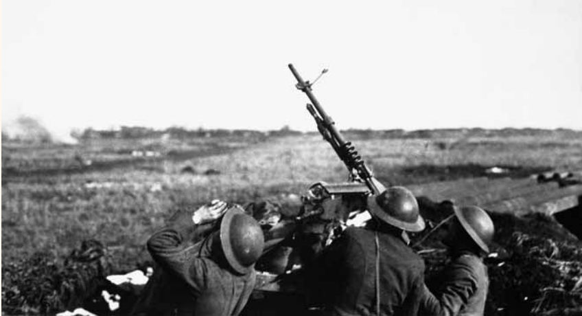
Luchtafweerschut, Frankrijk, 1914

Er bestaat een gereede kans dat zij te laat zijn, in het bijzonder als de aanvaller van doel verandert.