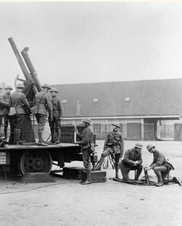
8-mm geschut tegen luchtdoelen, circa 1930

vijandelijke leger moeten uitputten met voortdurende aanvallen. De luchtmacht zullen de vijand direct in zijn hart raken.