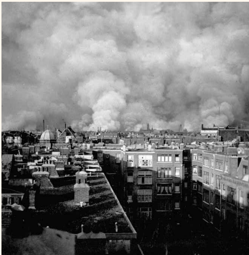
Bombardement op Rotterdam, 14 mei 1940

Sommige mensen beweren dat mijn duurzame bijdrage aan de ontwikkeling van Amerikaanse airpower bestaat uit het koppelen van het begrip luchtmachtautonomie aan 'onafhankelijke' luchtoperaties, zoals strategische bombardementen, die zich richten op het bereiken van onafhankelijke resultaten in plaats van eenvoudige steun aan land- en zeestrijdkrachten.