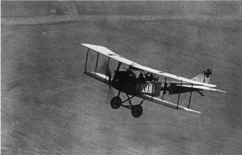
Duits militair vliegtuig tijdens de Eerste Wereldoorlog

dat de overwinning in een oorlog het gevolg zal zijn van de ineenstorting van het civiele moreel. Desondanks verwijst het nergens naar het bombarderen van bevolkingscentra en stelt uitsluitend voor doelen te bestoken van militaire aard. Wij beweren dat het bombarderen van industriecentra de fabrieken vernietigt die werk bieden aan de arbeiders. Het verlies van werk heeft een ontreddende invloed op de beroepsbevolking – vermoedelijk door verwar- ring en het verlies van inkomsten – en dat zal doorwerken in de gehele maatschappij. AP 1300 propageert dus een strategie die wezenlijk afwijkt van die van generaal Douhet. Die wil immers opzettelijk de burgerbevolking direct aanvallen.