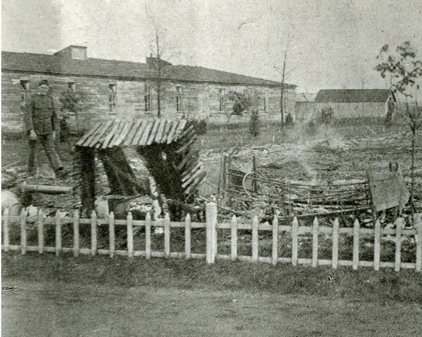
Een wacht bij een van de afgebrande barakken na relletjes die in oktober 1918 uitbraken in legerplaats De Harskamp; de onrust deed ook binnen het kabinet de vrees voor een revolutie opblaaien

SDAP-woordvoerder Ter Laan was des duivels en diende prompt een motie van wantrouwen in tegen de hele regering. Daarop werd een schorsing aangevraagd, ook al omdat er op dat moment maar tien Kamerleden aanwezig waren. Volgens de parlementair verslaggever van De Telegraaf ging het hier om een confrontatie tussen de legerleiding en het parlement waarbij volgens de linkse defensiewoordvoerders de positie en het prestige van de Kamerleden op het spel stond. Hij vond het om die reden een hoogst onverstandige actie. De motie maakte geen schijn van kans, omdat de linkse partijen nooit de steun van de rechterzijde zouden krijgen: 'Maar de Tweede Kamer