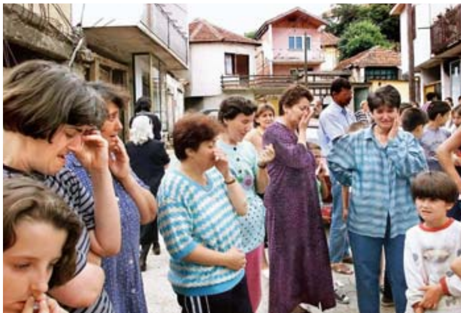
Huilende vrouwen in Kosovo, 1999

Het eerste niveau, het preconventionele niveau, wordt gekenmerkt door het feit dat regels en sociale verwachtingen extern zijn aan het individu. In de eerste fase gaat het om straf en