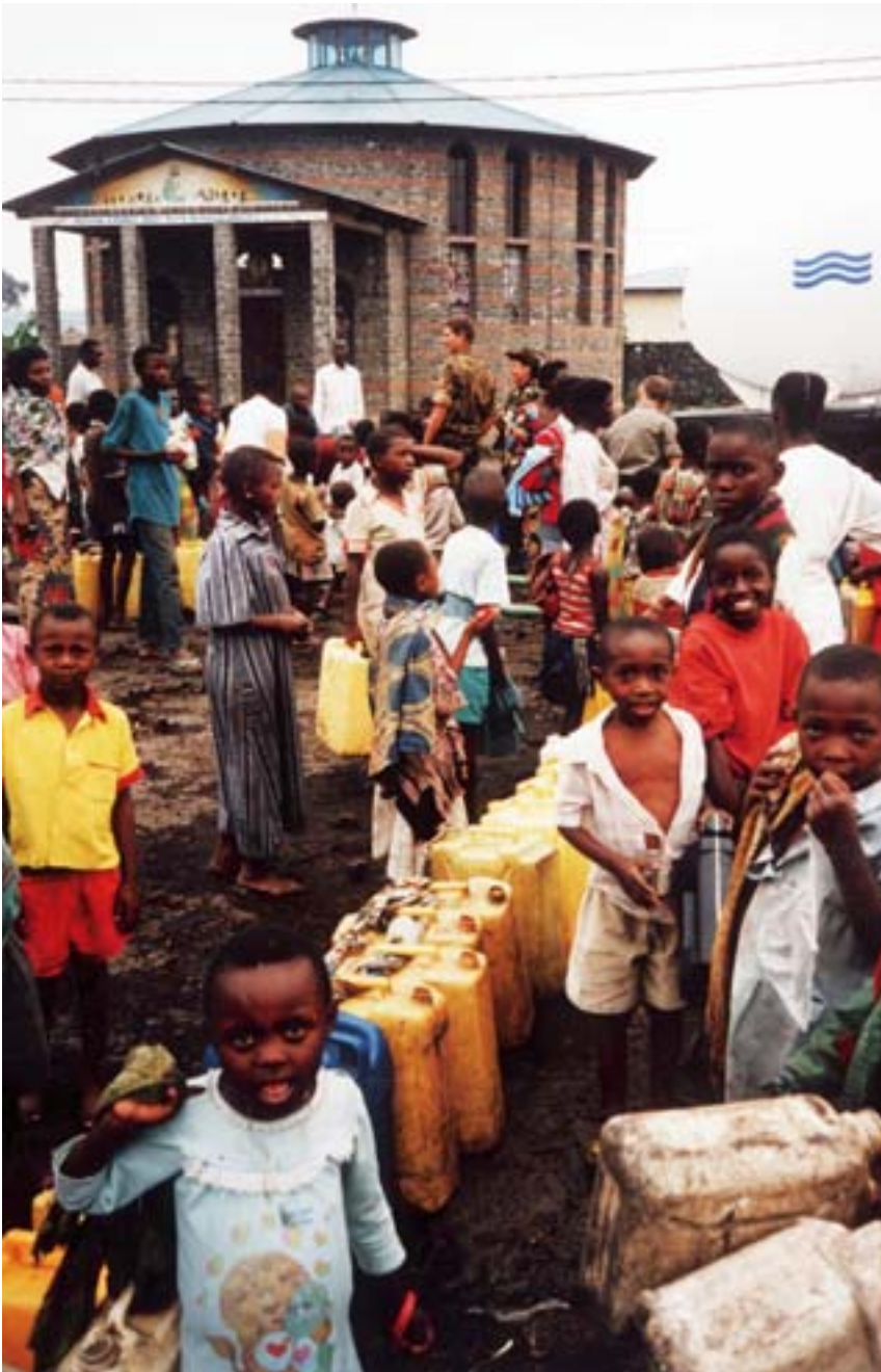
Nederlandse militairen verstrekken water aan Rwandese vluchtelingen in een vluchtelingenkamp in Goma, 1994

Cadetten en adelborsten, die nog in opleiding zijn, zijn over het algemeen nog niet op uitzending geweest. Een enkeling vormt hierop een uitzondering. Militairen uit de onderzoeksgroepen 'OKM' en 'HDV' hebben over het algemeen meer met operaties te maken gehad. Van de militairen die te maken hebben gehad met een moreel dilemma tijdens een uitzending wist