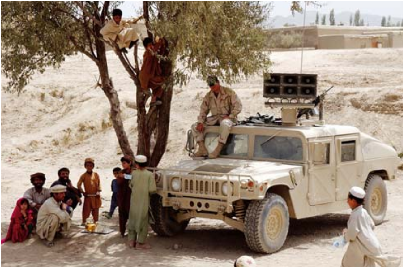
Old Orgun, Afghanistan. Het '345th Tactical Psyops Company Airborne Battalion' assisteert de Afghaanse regering bij het bouwen van een school. Deze school is de eerste in de provincie die toegankelijk is voor jongens én meisjes sinds 700 jaar. Hier ziet u een Amerikaanse sergeant tijdens de openingsceremonie

Zoals eerder vermeld, beschikt iemand over moreel oordeelsvermogen als hij of zij de morele aspecten van een situatie kan herkennen. Iemand die niet over een moreel oordeelsvermogen beschikt, kan morele dilemma's niet herkennen. Dit betekent dat als iemand aangeeft dat hij nooit een moreel dilemma heeft meegemaakt, het goed mogelijk is dat hij zich niet realiseert dat hij wel degelijk met een moreel dilemma werd geconfronteerd. Hij heeft het morele dilemma dan echter niet als zodanig herkend.