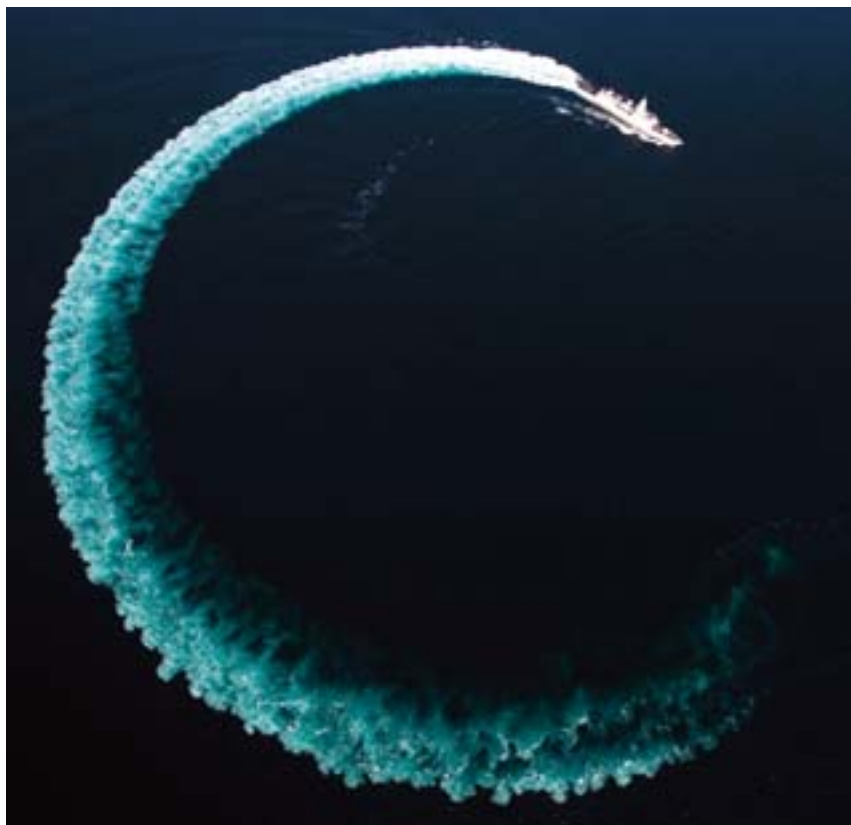
Hr. Ms. De Zeven Provinciën onder de kust van Pakistan, 2005

en tijdens een operatie. Ergens in het midden van het spectrum van beheersing is er een omslag waarbij de tegenstander een operationeel overwicht verkrijgt ten koste van de eigen troepen. Om succesvol in een kustgebied te kunnen opereren is 'kustoverwicht' noodzakelijk. De term kustoverwicht refereert aan een combinatie van overwicht op zee, op het land, in de lucht, in het informatiedomein en de beheersing van het elektromagnetisch spectrum. De hiermee samenhangende term is 'verzekerde toegang' ('assured access'). Van verzekerde toegang tot een kustgebied is sprake wanneer een eenheid kustoverwicht bezit.