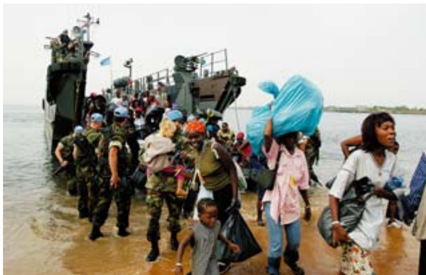
Eenheid van de Hr. Ms. Rotterdam zet Liberiaanse vluchtelingen aan land bij Monrovia, 2004

Vanaf 2001 werden de zeestrijdkrachten geconfronteerd met ontwikkelingen die een koersaanpassing noodzakelijk maakten. Ten eerste de reorganisatie van de defensieorgani-