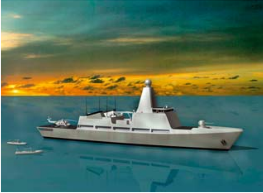
'Artist's impression' van een Ocean-going Patrol Vessel (OPV)

basing' concept voor de Nederlandse krijgsmacht werkbaar te maken zodat de ondersteuning van landoptreden vanuit een basis op zee mogelijk wordt. Dit vergroot het expeditionaire en het voortzettingsvermogen van de Nederlandse krijgsmacht. Deze ambitie krijgt onder andere haar beslag in de verwerving van nieuw materieel - de verwerving van het 'Joint Support Ship' ondersteunt dit concept in belangrijke mate - en in het oefenschema. Zo is in de oefening Joint Caribbean Lion 2006 het seabasing concept beoefend en zijn veel lessen geleerd die vervolgens in 'joint' procedures zijn vastgesteld.