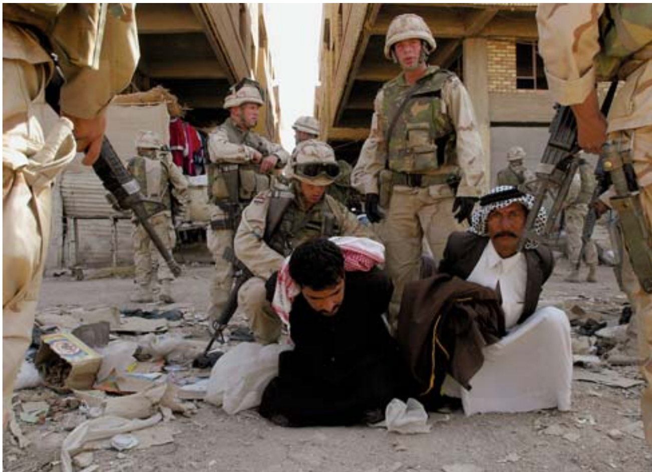
Nederlandse mariniers rollen een wapenmarkt op in het Iraakse As Samawah, 2003

Om een inschatting te maken van de uitdagingen om de integratie te doen slagen moeten we een basale vraag stellen: wat maakt personeel ook 'goed' personeel? Allereerst adequate opleiding en training, maar ook gedrag, instelling, vaardigheden en uitrusting. Zonder goed personeel kunnen taken en opdrachten niet worden uitgevoerd. Binnen de Zeestrijdkrachten wordt het belang van iedere werknemer benadrukt. Verantwoordelijkheden worden zo laag mogelijk in de organisatie belegd. Iedere werknemer immers levert direct of indirect een bijdrage aan veiligheid op en vanuit zee. Iedere militair krijgt een pakket aan vaardigheden mee dat hem/haar