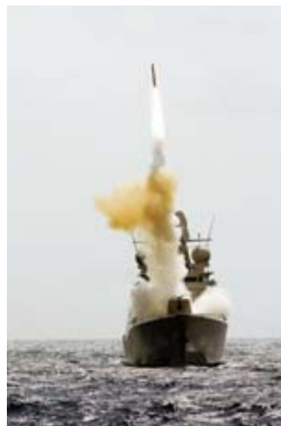
Missile lancering vanaf Hr. Ms. De Ruyter nabij Curaçao, 2006