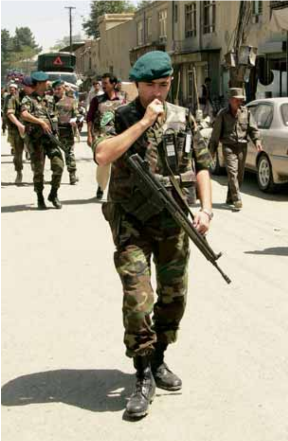
‘Turkse militairen in Kabul werden inderdaad niet aangevallen, in tegenstelling tot westerse troepen...’ Afghanistan, 2003

andere collega’s met de bedoelde kenmerken, en die noemde weer andere namen.