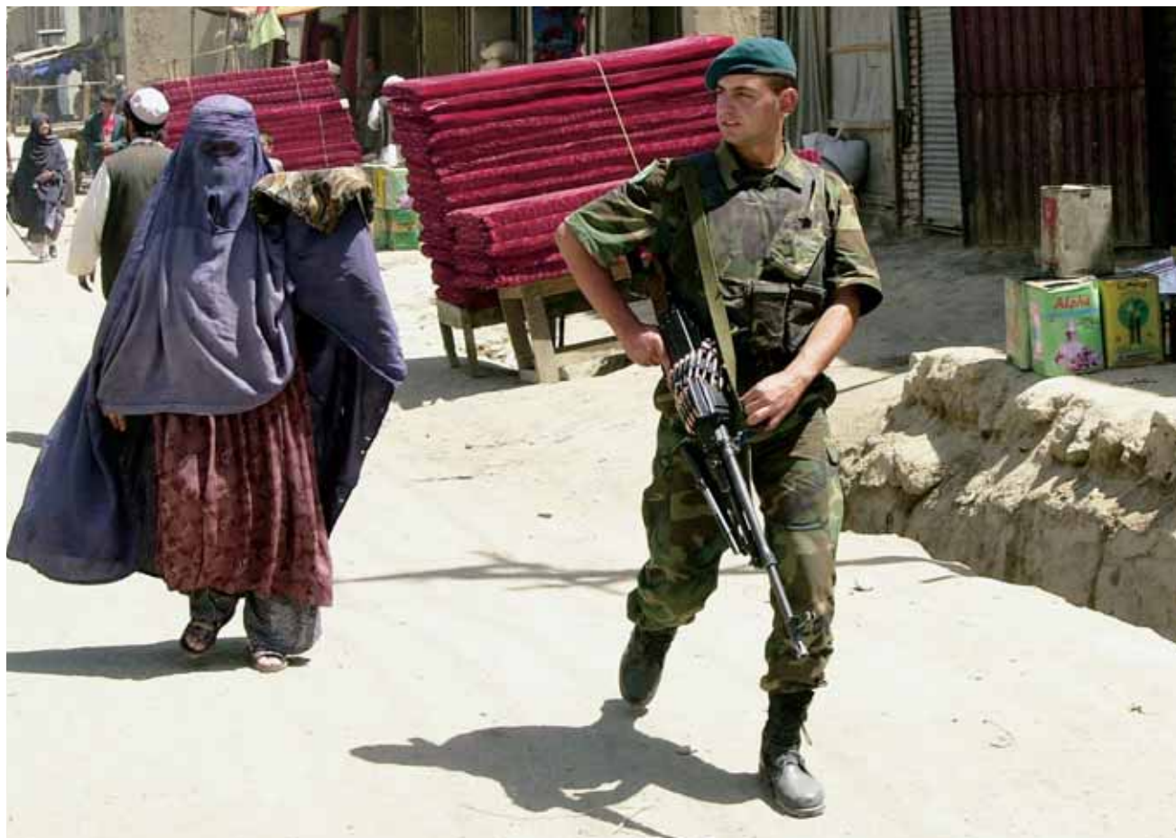
‘Moslimmilitairen die zijn uitgezonden naar islamitische samenlevingen beschikken over relevante culturele intelligentie’

niemand kent, en daar informatie van kunt krijgen, ken je iedereen – de hele buurt, familie of stam – die daarachter staat. 18