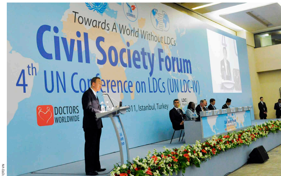
Toenmalig VN-chef Ban Ki-moon riep de afgevaardigden naar een Civil Society Forum van de VN in 2011 op tot het genereren van ideeën

Het inherent onstuimige proces van politieke en economische liberalisatie kan volgens Paris sociale spanningen opdrijven en stabiele vrede ondermijnen. 19 Doordat lokale bedrijven en economieën de top-down verandering van de macro-economische structuur niet aankunnen, stijgt de ongelijkheid in de al instabiele staten, neemt het draagvlak voor economische liberalisering af en neemt de kans op het opblazen van het gewapende conflict toe. 20