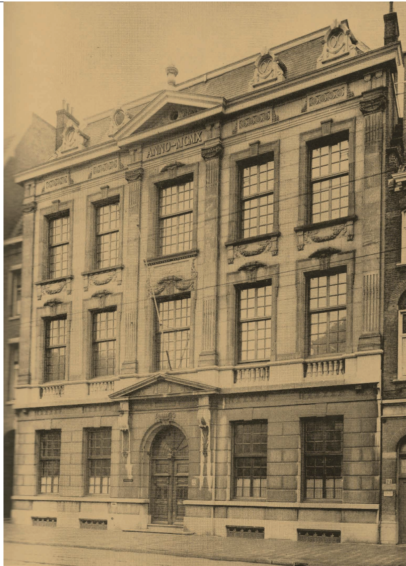
De VBK, die bijeenkwam in een pand aan de Fluwelen Burgwal, was in de beginjaren bij uitstek een Haagse club. De foto dateert van na de verbouwing van 1910

De VBK kreeg in de pers een positief onthaal. Onder de kop 'Eene goede zaak aangeprezen' heette ook De Militaire Spectator de nieuwe vereniging van harte welkom. Er was nu een middel geboren, schreef het blad, 'waardoor bij niet-militairen de zoozeer gewenschte bekendheid met krijgsaangelegenheden wordt in de hand gewerkt'. 18 Bij Blanken en de legertop viel de VBK, zoals te verwachten was, niet in goede aarde. Zij beschouwden haar als een 'comité van oproer en verzet'. 19 Verontwaardigd wezen zij een uitnodiging om lid te worden van de hand. Omdat de grondwet een frontale aanval