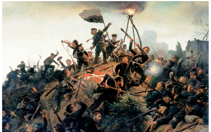
SCHILDERIJ WILHELM CAMPHAUSEN

Het gezamenlijke optreden van Pruisen en Oostenrijk tegen Denemarken in 1864 zorgde ook bij Nederlandse militairen tot ontzetting en zette de controverse tussen de legertop en kritische officieren op scherp