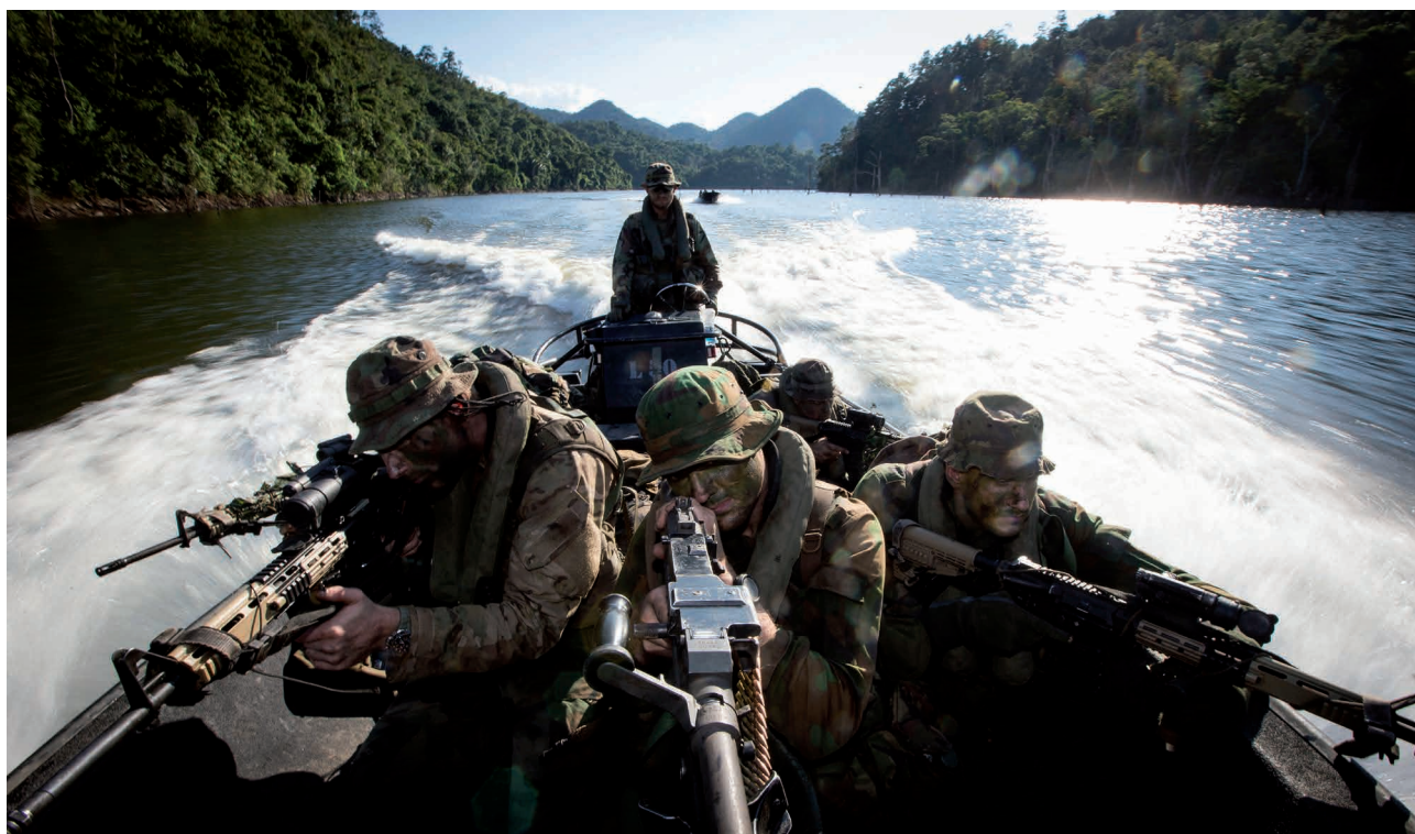
De samenwerking met de Royal Marines loopt al tientallen jaren: oefening met Britse mariniers in de jungle van Belize (2014)

Een ander voorbeeld van verbinding is die tussen de stad Rotterdam en Defensie, en specifiek het Korps Mariniers. Dit heeft vorig jaar geresulteerd in een krachtige bestuurs-overeenkomst met het Commando Zeestrijd-