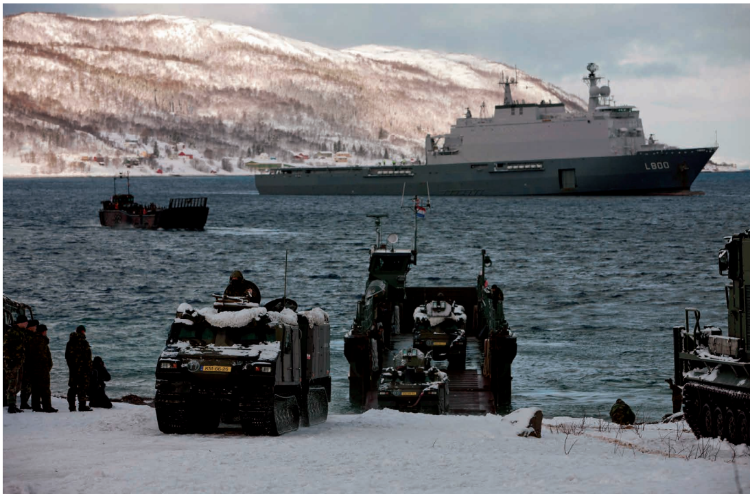
Het Navy-Marine Corps team: vanuit de Hr.Ms. Rotterdam landen Amerikaanse Mariniers met LCU's en BV's op de Noorse kust (2012)

Hierbij teken ik wel het volgende aan. Zoals gezegd bestaat het Korps Mariniers op dit moment uit zo'n drieduizend man. En we hebben een hoog ambitieniveau om een passend antwoord te kunnen bieden op verschillende soorten conflicten op elk moment. In de huidige constellatie houdt dit voor ons echter ook in dat we afhankelijk zijn van anderen, zoals voor aanvullende logistieke en gevechtsondersteuning die in Nederland bij