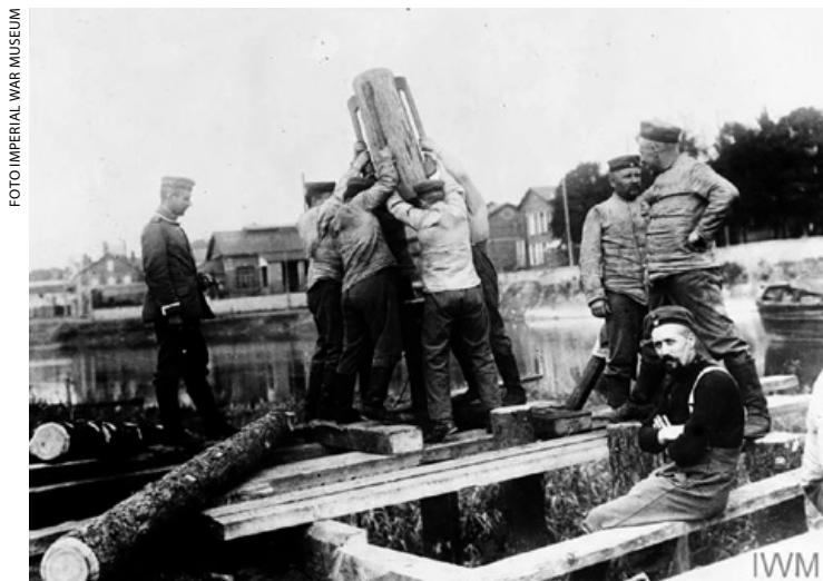
Duitse ingenieurs bouwen een brug aan het front in het westen (1914)

Na het onderzoek van de genieofficieren bleef het lang rustig. Het transport ging door en de Britten klaagden niet. De situatie veranderde toen de Britse minister van Buitenlandse Zaken Edward Grey in december 1916 werd opgevolgd door Arthur James Balfour. Balfour nam een minder milde houding aan dan zijn voorganger en begon Loudon geleidelijk onder druk te zetten. 36 Het eerste teken daarvan kwam in maart 1917. Via de Nederlandse gezant te Londen, R. De Marees van Swinderen, stuurde The Foreign Office het volgende bericht naar Loudon: 'Ik zou U een reeks van gevallen kunnen noemen (...) waarin Uwe regering steeds, in afwijking van algemeen geldende rechtsbeginselen, eene wetsinterpretatie van eigen maaksel in toepassing heeft gebracht, die zonder uitzondering den Duitschers ten goede komt. Ik noem U als zoodanige gevallen enkel maar de quaestie van vervoer van Duitschland naar België over Nederlandsch grondgebied van erts en zand en 'gravel', hetwelk, eenmaal ter bestemming aangekomen, voor militaire doeleinden wordt verwerkt...' 37 Loudon antwoordde dat er van militaire doeleinden geen sprake was. 'Aangezien uit het rapport der Nederl.[andse] officieren bleek dat voor de in België reeds uitgevoerde en nog uit te voeren niet-militaire werken zeer groote hoeveelheden