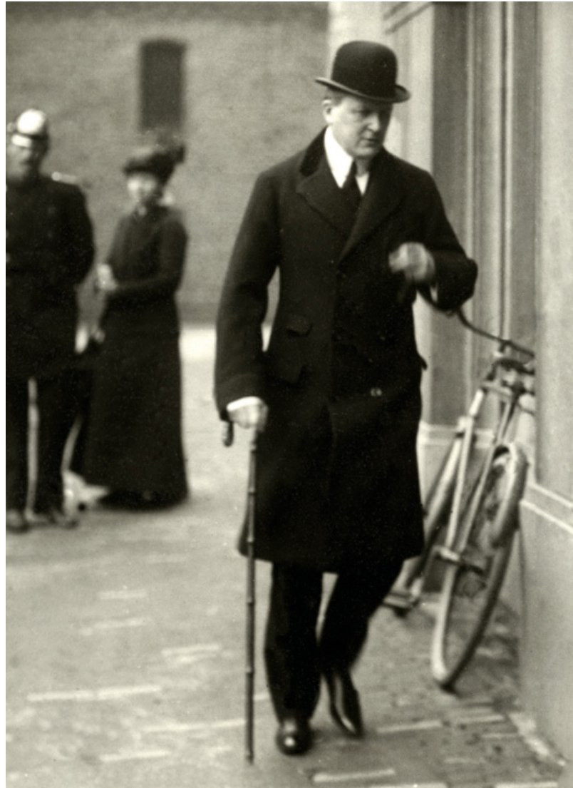
Minister van Buitenlandse Zaken John Loudon moest schipperen tussen Duitse en Engelse wensen over de invulling van de Nederlandse neutraliteit