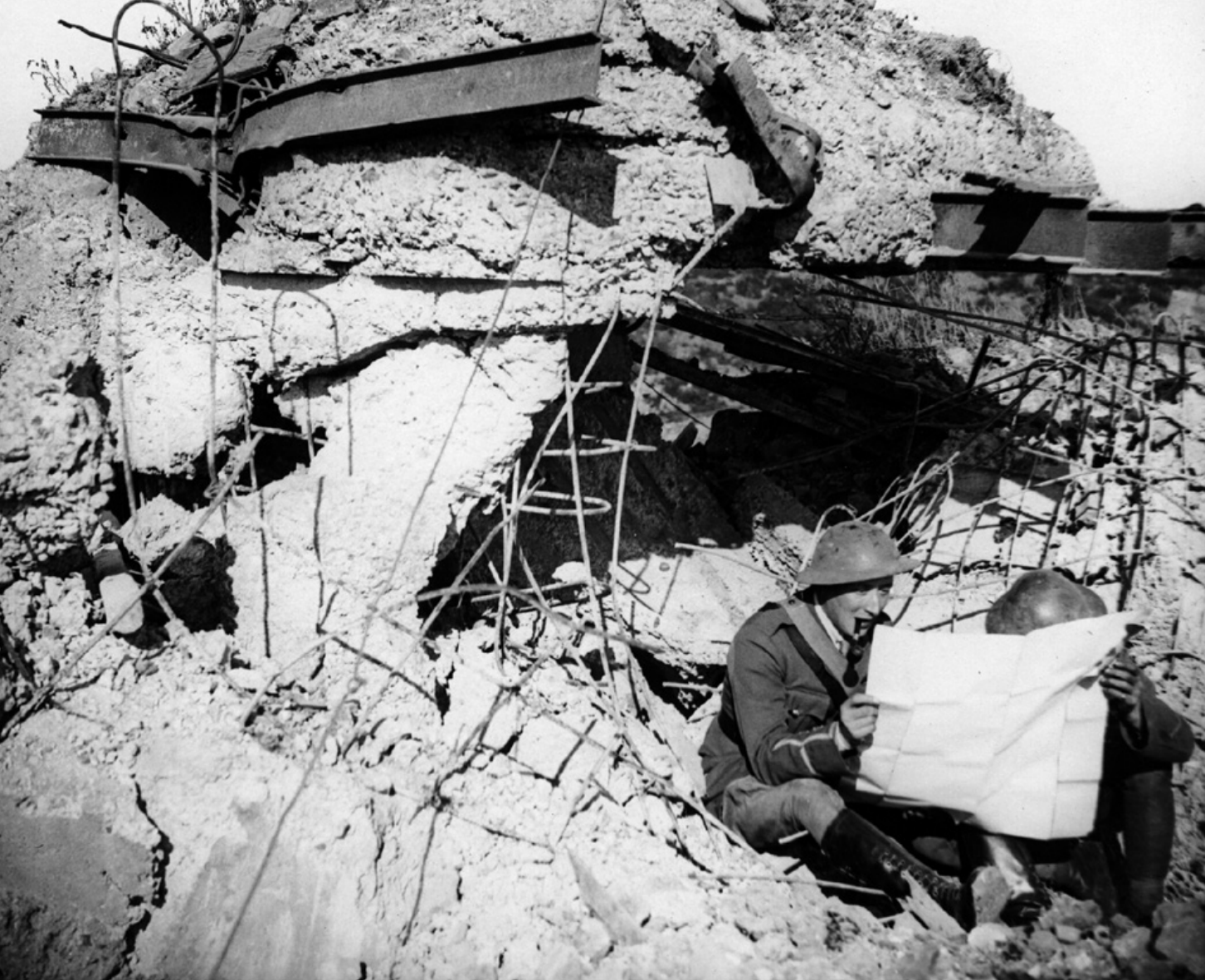
Twee Britten bij een Duitse pill box. Vermoed werd dat de vrijwel onverwoestbare pill boxes van grind uit de Rijn gemaakt waren dat via Nederland vervoerd was