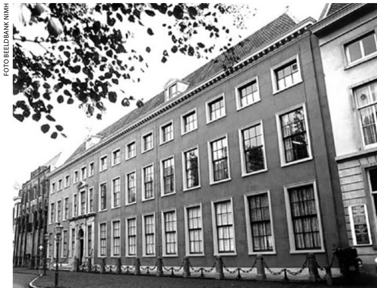
De Generale Staf was in de mobiliteitsjaren 1914-1918 gevestigd aan de Lange Voorhout 7 in Den Haag. Sectie IV kreeg later een onderkomen op nummer 52