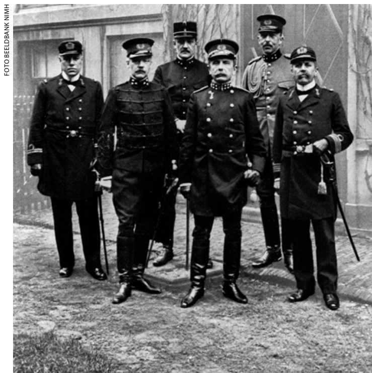
Het Bureau Generale Staf tijdens de mobilisatieperiode 1914-1918. Derde van rechts generaal Cornelis Snijders, de opperbevelhebber van de Land- en Zeemacht