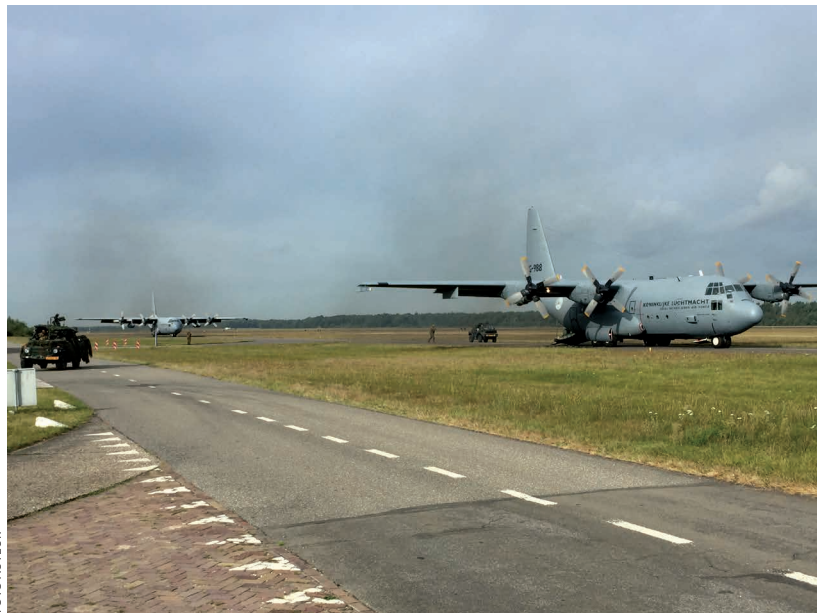
Met airlanding-operaties kunnen eenheden en materieel over grote afstand worden ingevlogen (oefening Falcon Autumn, 2016)

Dat geldt ook voor de Luchtmobiele Brigade. In de beginperiode maakte de brigade jarenlang deel uit van de Multinational Division Central (MND-C). Deze Divisie had binnen de NAVO de rol om als reserve te opereren voor de Northern Army Group. MND-C werd opgericht in april 1994 en opgeheven in oktober 2002. In 2002 bleek uit de NATO Force Structure Review dat er geen behoefte meer was aan de MND-C. De multinationale Divisie bestond, naast enkele ondersteunende eenheden, uit vier brigades: