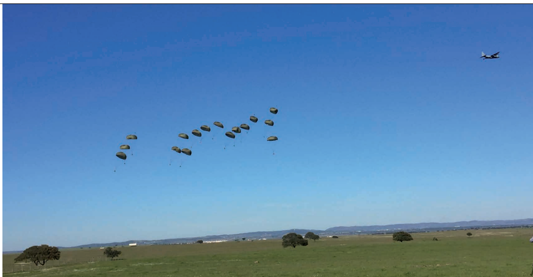
Het concept van air cargo-drop is nog volop in ontwikkeling. De eerste drop van 16 Container Delivery Systems (CDS) gelijktijdig vond plaats tijdens de internationale oefening Real Thaw in Portugal (2016), een joint mijlpaal

in humanitaire operaties. De combinatie van grondeenheden, helikopters en transportvliegtuigen maakt dat grote afstanden snel kunnen worden overbrugd en afgelegen gebieden of gebieden die afgesneden zijn als gevolg van natuurgeweld toch kunnen worden bereikt. Een concreet voorbeeld is voedseldropping. Personeel van 11 Bevoorradingscompagnie is in staat paletladingen gereed te maken voor airdrops met transportvliegtuigen van 336 Squadron van de Koninklijke Luchtmacht. Deze brede inzetbaarheid geldt expeditionair, maar ook op nationaal grondgebied kunnen de unieke capaciteiten van de brigade van meerwaarde zijn voor de civiele autoriteiten in Nederland. Zo is de brigade prima in staat om bij grote wateroverlast met helikopters en ondersteunende capaciteiten afgelegen gebieden te bereiken of verkeersdrukke routes te overbruggen.