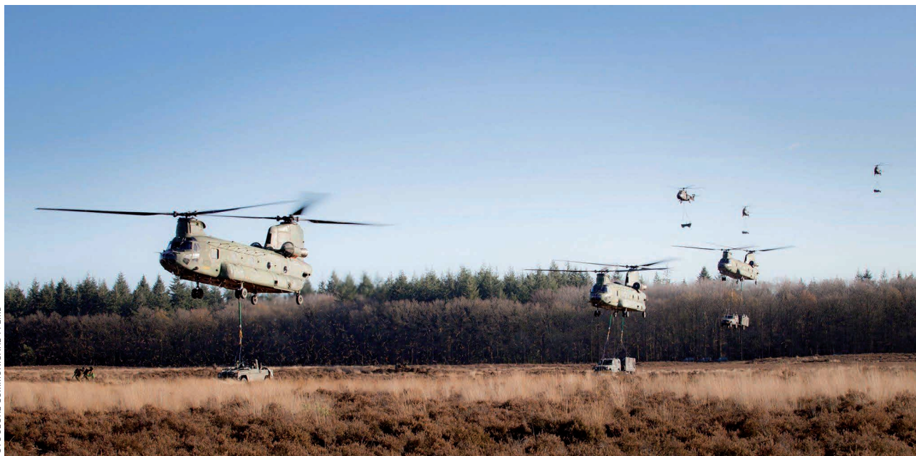
De grond/lucht-coördinatie en organisatie bij de inzet van meerdere aantallen van meerdere types helikopters vereist veel specifiek opgeleid en getraind personeel

gaat dat dan, met welke middelen en op welke manier? Ten derde loopt er onder leiding van de CDS een denkproces in het kader van de Doorontwikkeling Krijgsmacht (DOKM). Ik blijf weg van een inhoudelijke relatie daarmee, maar zal in het kader van dit artikel mijn persoonlijke visie geven op de toekomst van de Nederlandse air manoeuvre-capaciteit.