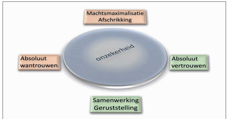
Figuur 1 Het veiligheidsdilemma bevindt zich in het gebied van onzekerheid binnen het spectrum van wantrouwen, vertrouwen, machtsmaximalisatie en samenwerking

Aan de andere kant hoeft onzekerheid ook niet te betekenen dat samenwerking of vreedzame co-existentie per definitie onmogelijk is. Staten kunnen bijvoorbeeld een zogeheten ‘gevoeligheid voor een veiligheidsdilemma’ ontwikkelen. 16 Daarmee proberen zij zich te verplaatsen in de angsten en motieven van de ander, waarmee ze onderling wantrouwen en onzekerheid kunnen beperken en een meer coöperatieve beleidskeuze mogelijk is. Een bekend voorbeeld is hervormingspolitiek (perestrojka) en het glasnost-concept van Gorbatsjov. 17 Dit leidde uiteindelijk tot een toenadering tussen de twee machtsblokken en heeft het veiligheidsdilemma verzacht.