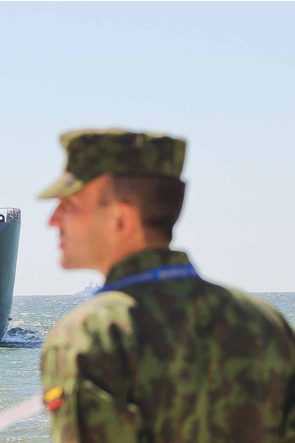
landen, die daarom vroegen bij de NAVO-top in Warschau

handelen van de NAVO ligt. We laten daarbij zien dat de kritiek, ook van de kant van het RAND-rapport, dat de NAVO in de Baltische staten niet doortastend optreedt tegenover Rusland, enige nuancering behoeft. 9