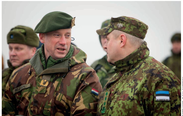
Oefening Baltic Bison, Estland, 2015

Van oudsher is de grootsheid van Rusland gekoppeld aan militaire macht. 50 De huidige modernisering is echter vooral een restauratie van de verwaarloosde Russische krijgsmacht uit de jaren '90 en verloopt niet geheel probleemloos. 51 Ondanks de Russische toename van militair potentieel en investeringen, is het