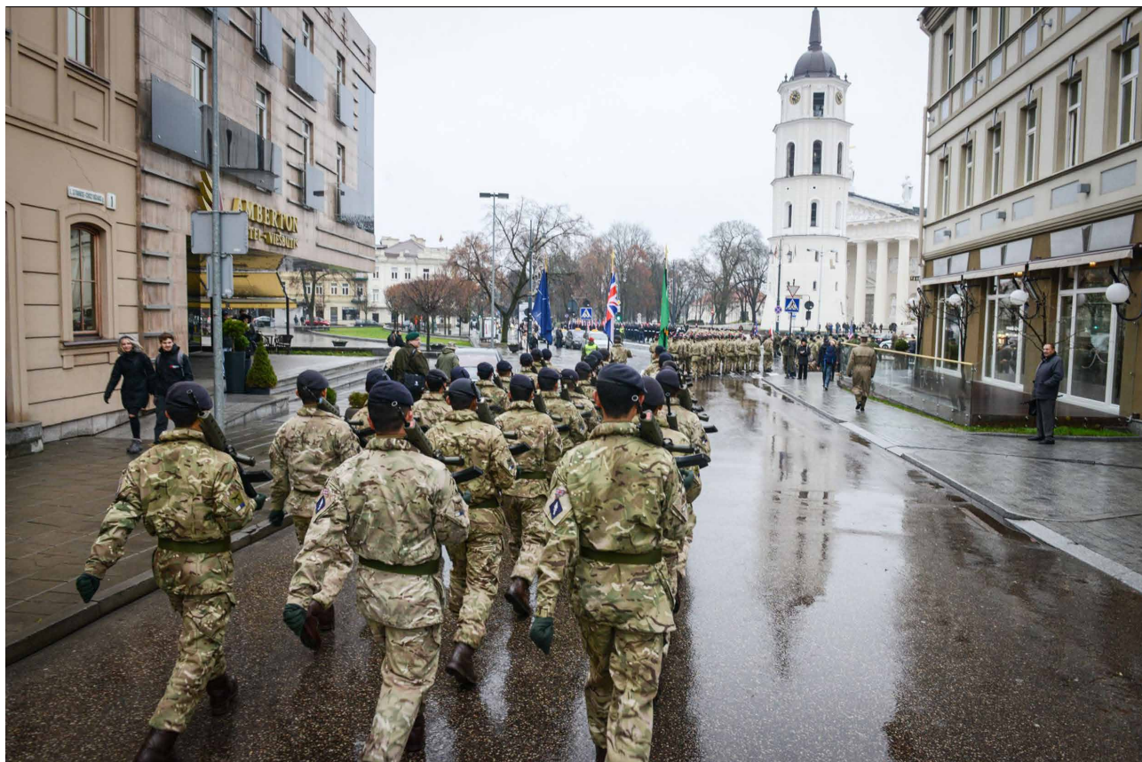
Britse militairen marcheren op het plein voor de kathedraal in Vilnius (Litouwen) tijdens de jaarlijkse NAVO-oefening 'Arcade Fusion', bedoeld om de interoperabiliteit in commandovoering tussen de NAVO-leden te vergroten

totale militaire potentieel en het defensiebudget van de NAVO vele malen hoger dan dat van Rusland.