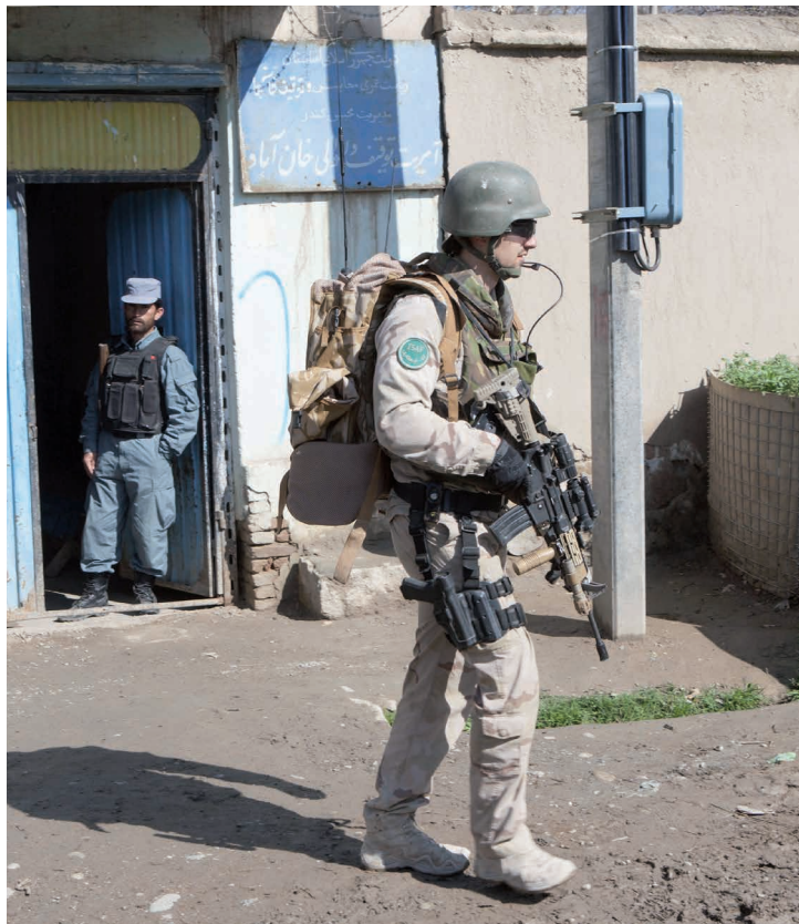
Verkenningpatrouille in Khanabad, Afghanistan. Een mindfulness-training kan bijdragen aan een veiliger vredesbewaking en voorkomt wellicht latere posttraumatische klachten

laatste wat een professional kan gebruiken. Kortom, onbedoeld worden militairen mentaal minder weerbaar op missie gestuurd. Lichamelijk zijn ze wellicht goed voorbereid, en zijn de noodzakelijke skills and drills uitentreuren geoefend, maar hun cognitieve vermogens zitten op dat moment deels in een 'dip'. Uit het onderzoek van Jha blijkt ook dat een mindfulness-training de achteruitgang in cognitieve vermogens die is veroorzaakt door een intensieve opwerkperiode, kan voorkomen. 14