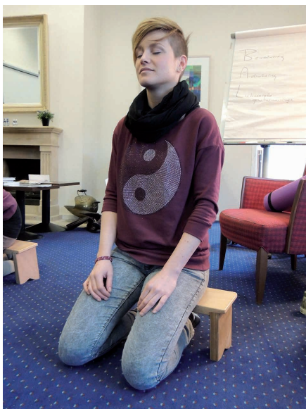
Deelnemer aan mindfulness-training in Beukbergen doet een bodyscan

nieken en yoga. Een voorbeeld daarvan is de bodyscan (zie ook tabel 1), waarin de aandacht systematisch op alle delen van het lichaam wordt gericht. Zo oefent men de 'aandachts-spier' en leert men aandachtiger luisteren naar het eigen lichaam. Het lichaam geeft immers de hele dag door signalen af. Wanneer men daar tijdig naar luistert kan worden voorkomen dat spanningen te hoog oplopen, of dat pijn steeds erger wordt.