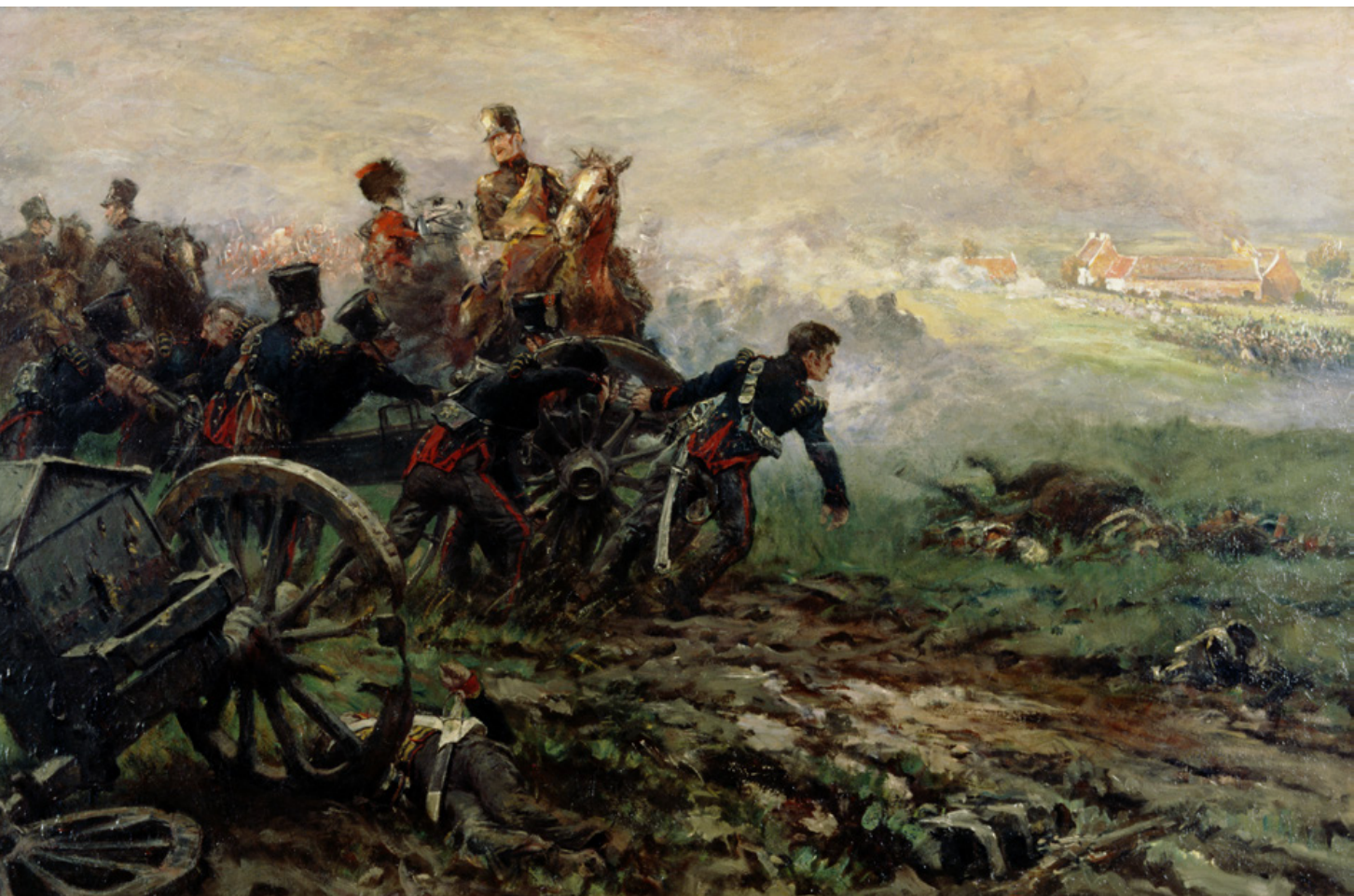
Batterij Kraemer de Bichin bij Waterloo: aan de artillerie, die geen vaandels of standaarden had, konden geen opschriften worden toegekend