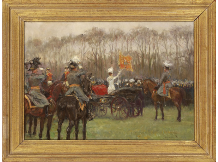
Koningin Wilhelmina reikt op het Malieveld in Den Haag de nieuwe vaandels en standaarden uit, 21 september 1893 (schilderij Jan Hoyneck van Papendrecht)

De minister nam de gelegenheid te baat de commissie bij de les te houden. Hij wees er nogmaals op dat opschriften beperkt dienden te blijven tot ‘de roemrijkste verrichtingen’ van de strijdmacht, de ‘heldenfeiten’. Bij veel van de door De Bas bestudeerde krijgsverrichtingen uit de jaren 1813-1814 was van enig contact met de vijand geen sprake geweest. ‘Is het dan goed’, vroeg Seyffardt zich af, ‘om een vaandel te sieren met de herinnering aan een dergelijk niets betekenend feit? Men verkleint op die wijze de waarde van andere vaandelopschriften, waarvan