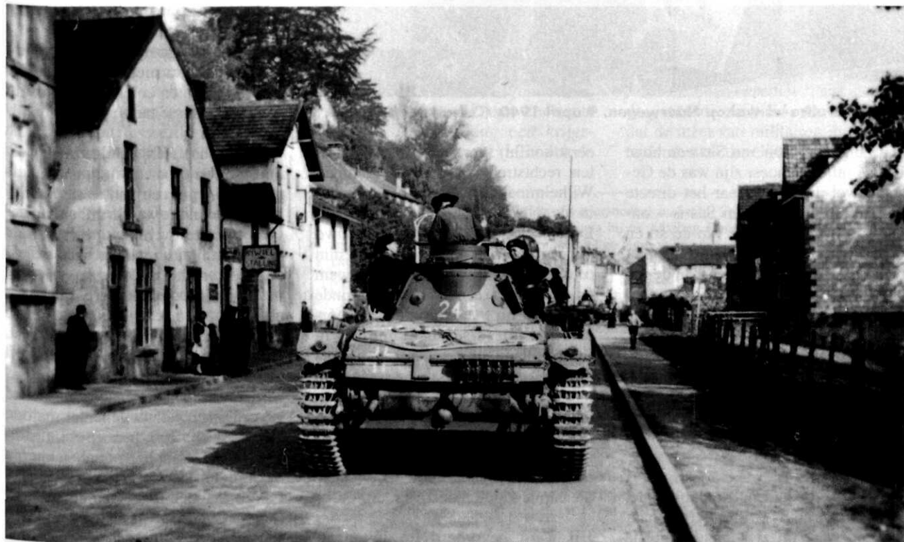
Duitse opmars in de omgeving van Valkenburg (L), 10 mei 1940

Toen Hitler op de hoogte werd gebracht dat de aanval was verraden was hij woest. Hij eiste de arrestatie van de verrader. Onmiddellijk na de capitulatie werd een speciaal commando belast met het zoeken naar de verrader. Ook in de ministeries in Den Haag werd gezocht bewijzen vooral naar berichten van de militaire attaché uit Berlijn. In de haast om weg te komen naar Londen was minister Kleffens zijn koffertje vergeten en dat werd meteen gevonden, in beslag genomen en per koerier naar Berlijn gestuurd. In het koffertje zat een dagboek maar ook een briefje waarop stond dat majoor Sas had gewaarschuwd voor de komende aanval op 10 mei.