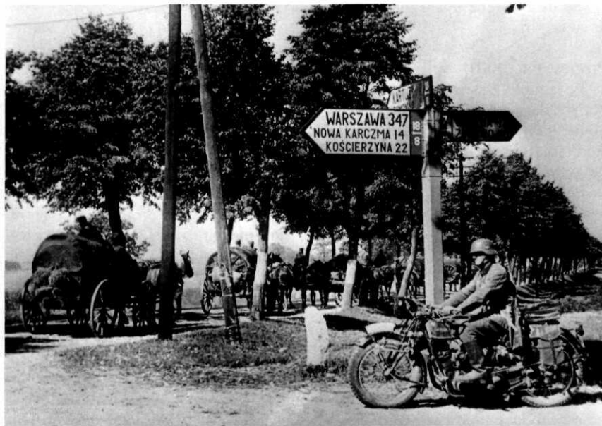
Duitse troepen bij Warschau, 1939

Zo keerde in april 1939, inmiddels majoor, Sas terug naar Berlijn waar hij als eerste zijn goede vriend Oster opzocht. De twee mannen hadden elkaar veel te vertellen en Oster bracht Sas op de hoogte van de mislukte staatsgreep maar ook van de nieuwe plannen die werden voorbereid. Sas