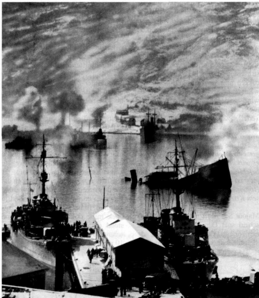
Duitse aanval op Noorwegen, 9 april 1940

Dat de goede bron van Sas een hoge Duitse militair moest zijn was de Gestapo wel duidelijk maar het directe verband tussen Oster en Sas is – ondanks al het speurwerk van de SD en Gestapo – nooit gevonden. Ook niet toen Oster werd gearresteerd in de nasleep van de aanslag op Hitler op 20 juli 1944. Wel zijn door toeval alle plannen voor de staatsgreep die Oster had voorbereid ontdekt en na lange verhoren werd Oster vlak voor het eind van de oorlog nog opgehangen, evenals zijn baas Wilhelm Canaris, in het concentratiekamp Flossenburg in Zuid Duitsland.