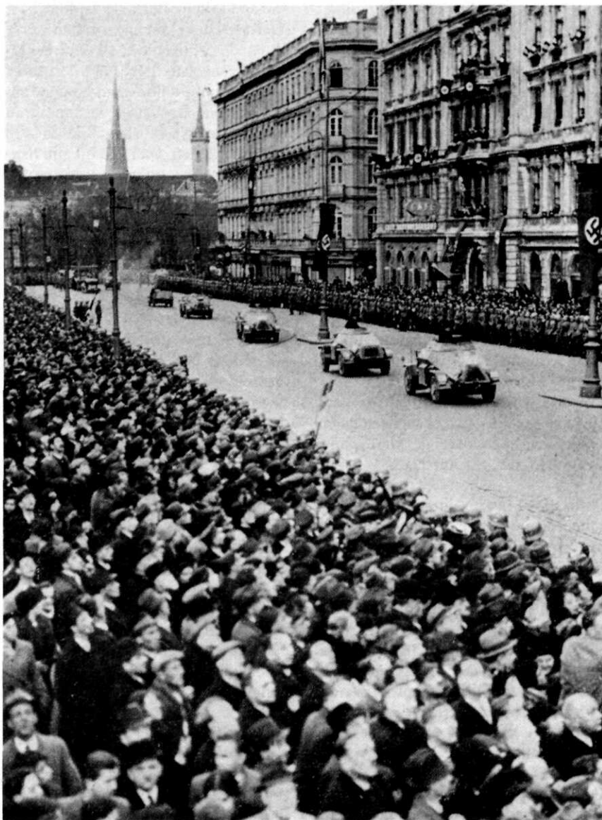
Intocht Duitse militairen in Wenen na de Anschluss van Oostenrijk, 12 maart 1938

Zonder dat de anderen het wisten had Oster met de aanvoerder van deze stoottroep (majoor Wilhelm Heinz) afgesproken dat Hitler bij een geprovoceerd vuurgevecht moest worden gedood. Ook alle partijcentrales, het Gestapo-hoofdkwartier, de radiozenders en SS-kazernes bij Berlijn moesten in één klap worden uitgeschakeld