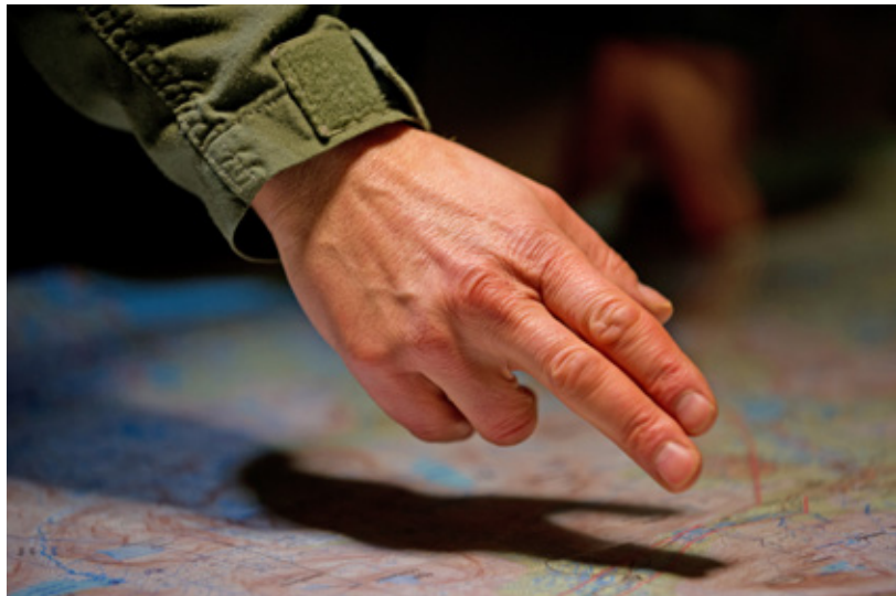
De vermeende mate van richtingsgevoel kan bijdragen aan heersende normbeelden over wat een 'goede' militair is

verantwoordelijkheid om als vertegenwoordiger van gevoelens van cadetten op de KMA op te treden, omdat ik zulke sensitieve onderwerpen heb onderzocht. Het bevestigt opnieuw hoe relevant dit onderzoek is.