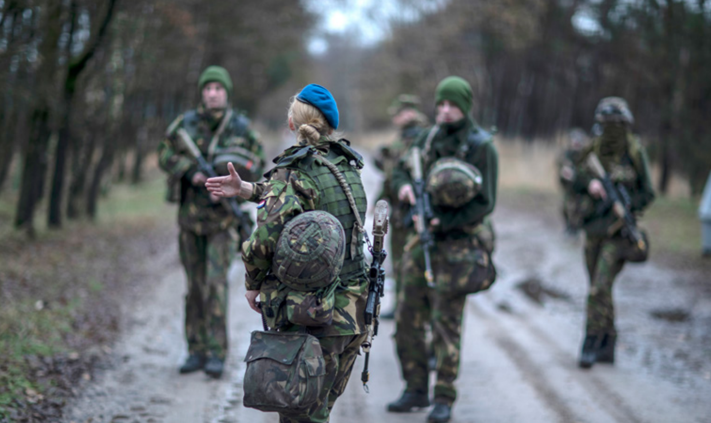
Bivak van KMA-cadetten