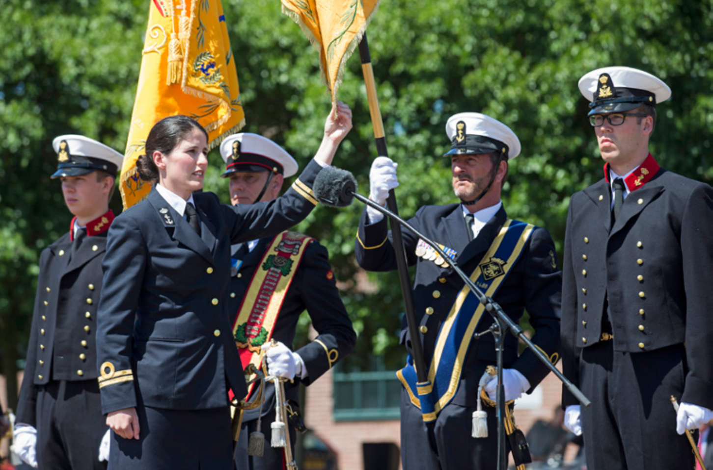
De militaire eed heeft sinds 1815 een vaste woordformule en de procedure en het protocol van elk krijgsmachtdeel worden gevolgd bij het uitspreken ervan. Militairen zweren of beloven met de hand aan het vaandel of standaard van hun moedereenheid

bevelen op te volgen. 35 In de context van de eed komt het erop neer dat militairen zweren of beloven bereid te zijn om te handelen naar ‘de wetten’, kennelijk inclusief de Grondwet, waarin de koning als instituut al is vereeuwigd.