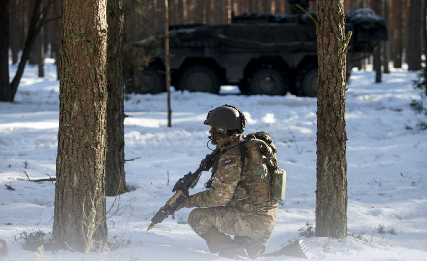
Oefening in Litouwen voor de enhanced Forward Presence van de NAVO. Aanwezigheidsmissies als deze zijn goede mogelijke wijzen van inzet voor 13 Lichte Brigade