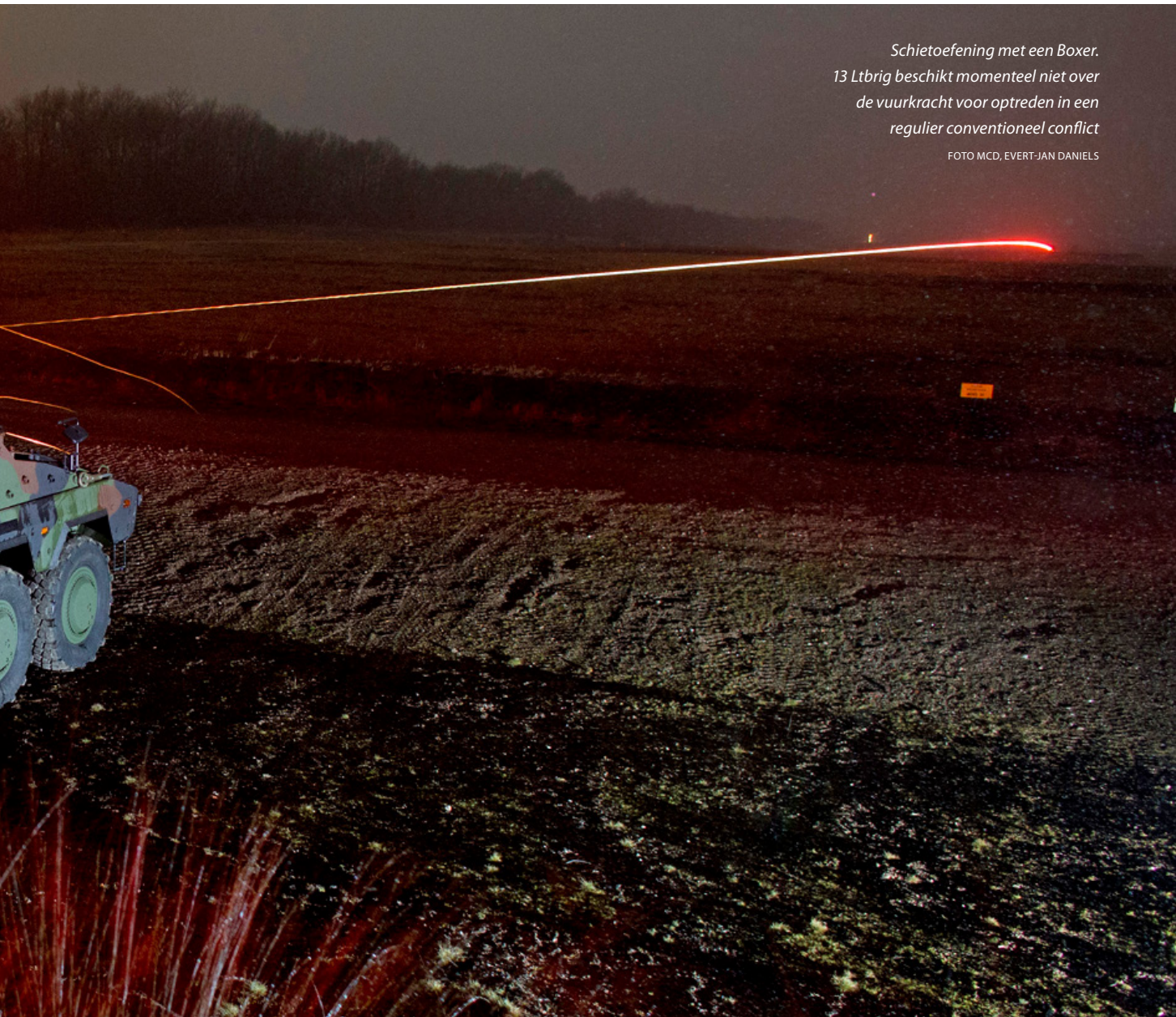
Schietoefening met een Boxer. 13 Ltbrig beschikt momenteel niet over de vuurkracht voor optreden in een regulier conventioneel conflict