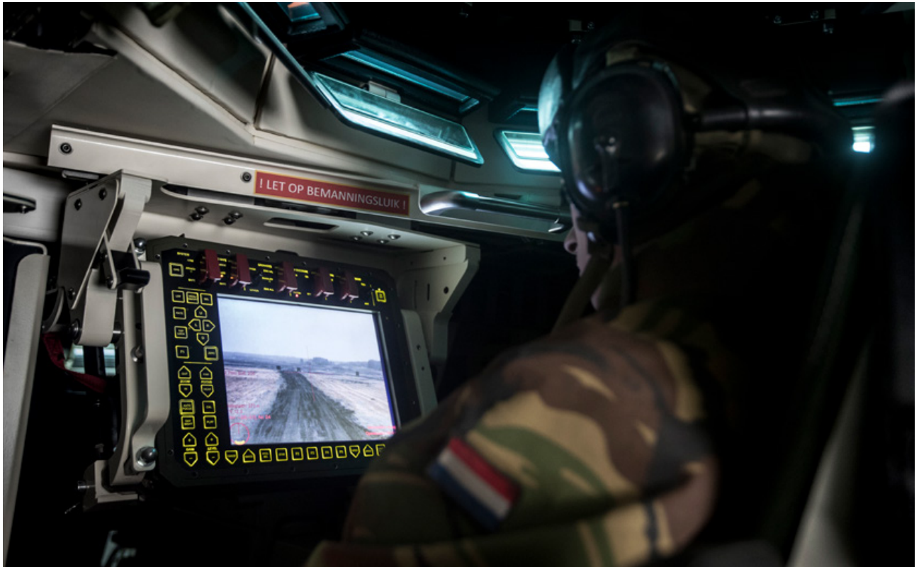
Schietoefening met de Boxer in Duitsland. De saving grace van dit voertuig vindt men in de modaliteit en mobiliteit