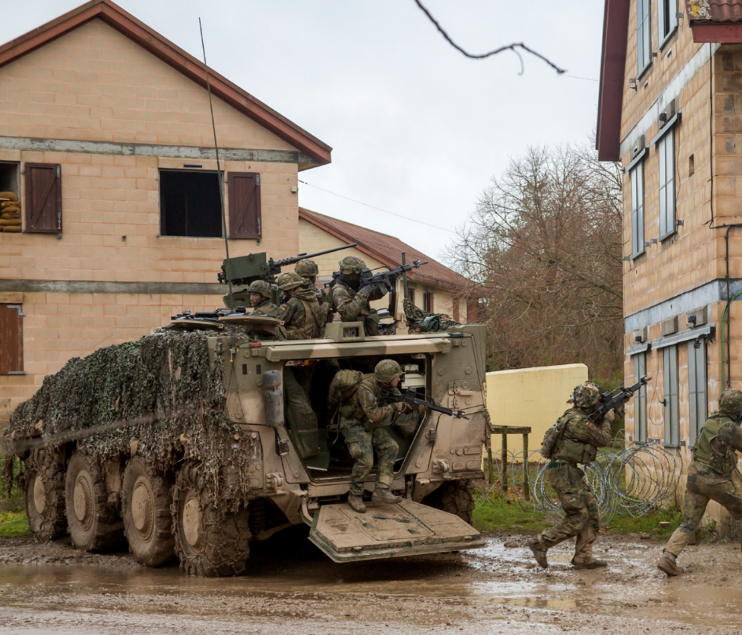
Duitse militairen op oefening in Groot-Brittannië. De Duitse Boxer is vrijwel gelijk aan de Nederlandse, maar vervult een andere conceptuele rol: infanterie beschermd vervoeren naar het gevecht, dat te voet wordt gevoerd

Als laatste beweegt 13 Ltbrig zich met het OCLB richting verdergaande specialisatie, niet alleen qua materieel, maar met name in de conceptuele component. Dit betekent dat de krijgsmacht straks is uitgerust met lichte, gemotoriseerde, gemechaniseerde en amfibische infanterie-eenheden met alle een andere gedachte over hoe te vechten. Daarnaast zijn er nog special forces aanwezig bij twee krijgsmachtdelen. Een vraag die hierbij gesteld moet worden is of deze verdere specialisatie gewenst is voor de kleine Nederlandse krijgsmacht. 40