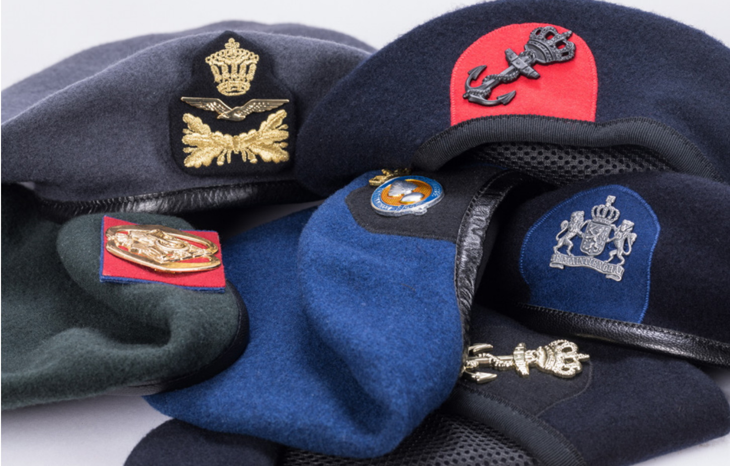
Het vraagstuk van legervorming is krijgsmachtbreed. In dit artikel dient 13 Lichte Brigade als casestudy