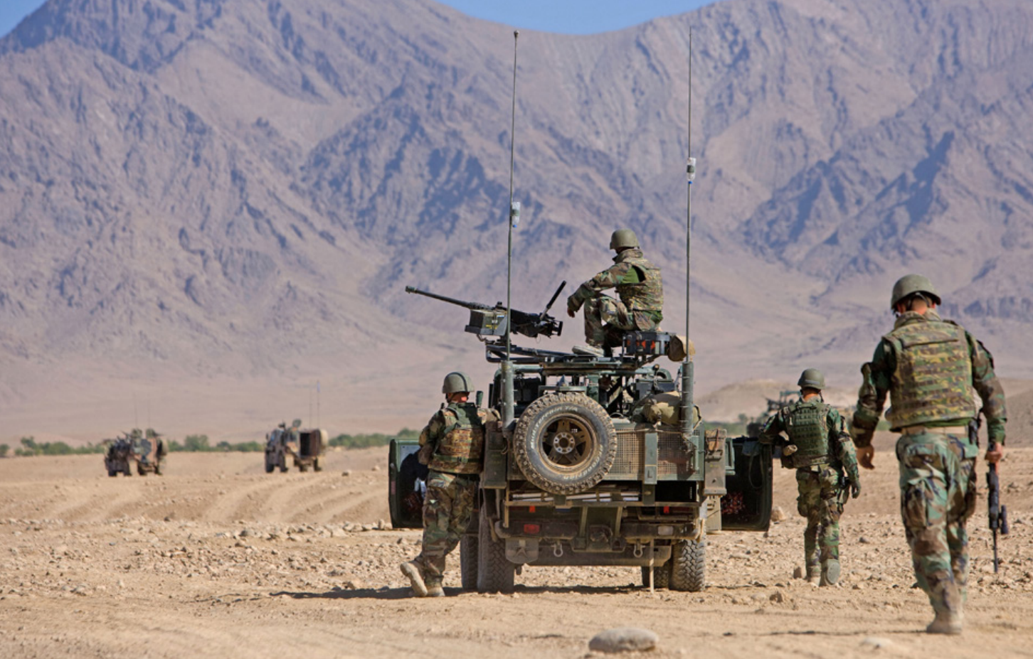
Nederlandse ISAF-militairen in Afghanistan. Westerse landen richtten zich in de periode 2001-2014 met name op statebuilding, maar hun krijgsmachten bleken niet voorbereid op de realiteit van de conflicten in bijvoorbeeld Irak en Afghanistan