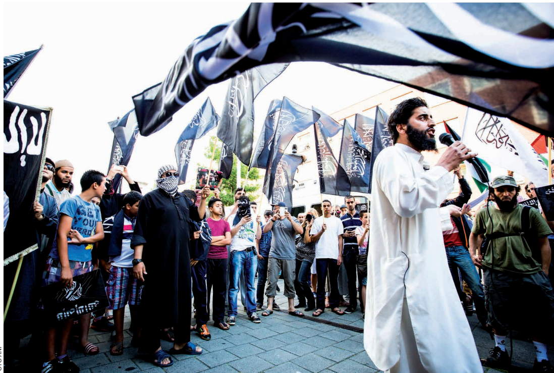
Een pro-IS demonstratie in Den Haag, 2014

Afghanistan te realiseren. Daarmee leek de dreiging van jihadisme een marginaal probleem te zijn.