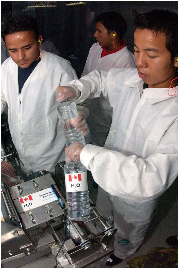
Het 'Canadian Forces Contractor Augmentation Program' contracteert logistieke dienstverlening voor operaties. CANCAP-werknemers voorzien flessen bronwater van etiketten