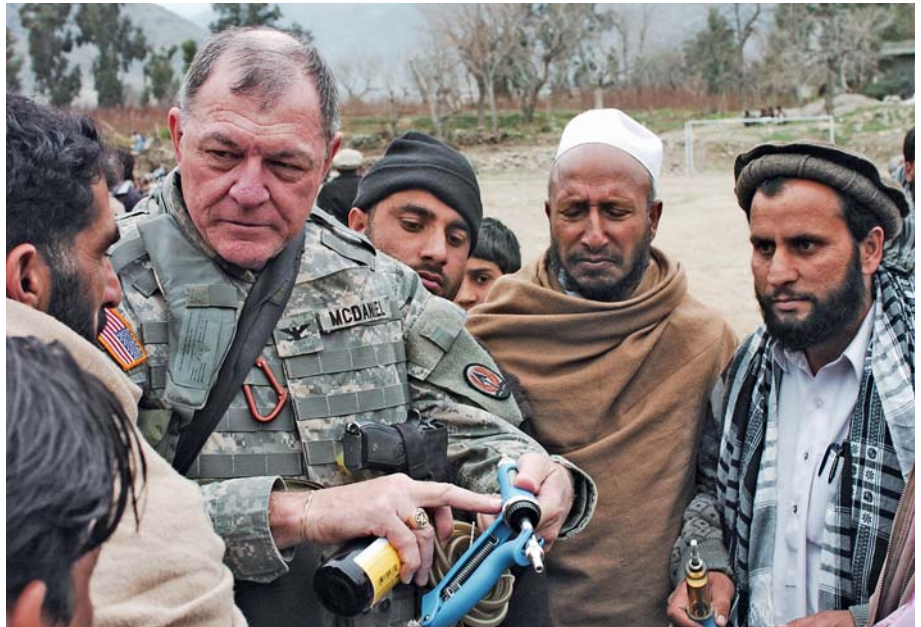
Op een conferentie in Asadabad legt een Amerikaanse kolonel aan Afghaanse veeartsen uit hoe de medicijnen werken. Afghanistan, 2007