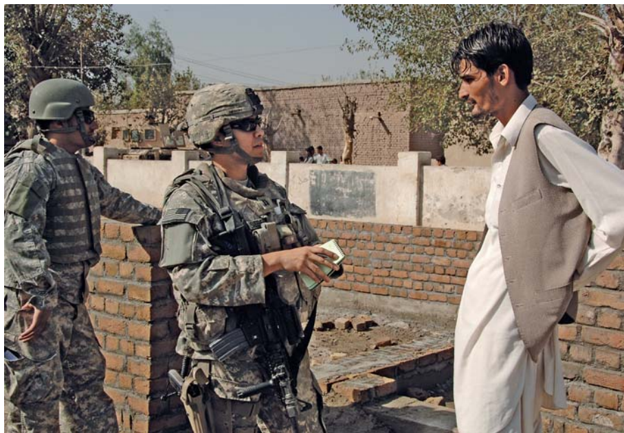
Overleg met een Afghaanse contractant die een school bouwt in Jalalabad. Afghanistan, 2008

Armed forces can plug in and operate, that is the current set up. When leaving, they just disconnect and other units can plug in again and start the operation. 8