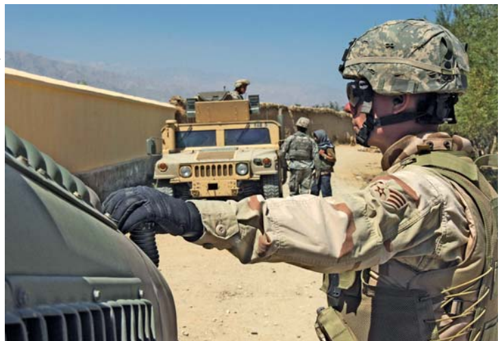
Beveiliging voor het Bagram 'Provincial Reconstruction Team' in Afghanistan. In tegenstelling tot bijvoorbeeld de VS contracteert Nederland op basis van de behoefte die vooraf en tijdens de missie ontstaat. Zo zijn er aparte contracten afgesloten voor luchttransport, brandstofvoorziening en catering

voor de levering van goederen en diensten aan de troepen in Afghanistan. In de uitvoering van de raamcontracten door Canada, het Verenigd Koninkrijk en de Verenigde Staten valt op dat het Verenigd Koninkrijk de dienstverlening voor een bepaald aantal jaar tegen een vaste vergoeding heeft afgekocht. Canada en de VS hebben er echter voor gekozen om de vergoe-