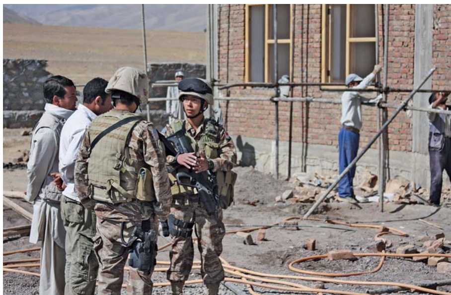
Overleg met de lokale contractanten op de bouwplaats van het Bamyán 'Regional Health Training Center'. Afghanistan, 2008

De laatste rij in tabel 2 laat zien dat de krijgsmachten onderling ook diensten en producten kunnen leveren. Binnen de NAVO is daarvoor een Standard NATO Agreement (STANAG) opgesteld. De STANAG bevat de procedures voor de administratieve en financiële afhandeling van onderlinge dienstverlening. Onderlinge dienstverlening wordt in het missiegebied verrekend. Dit verrekenen kan financieel zijn, maar het is ook mogelijk om bijvoorbeeld brandstof van een NAVO-land te gebruiken en de hoeveelheid gebruikte brandstof op een later moment terug te geven, als de eigen voorraden weer toereikend zijn.