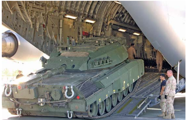
Krijgsmachten kunnen ook onderling goederen of diensten 'sourcen'. Amerikaanse vliegers vervoeren een Canadese Leopard-tank naar KAF

De ondersteuning van de Taskforce is een nationale verantwoordelijkheid, terwijl de ondersteuning van het Regional Command een gemeenschappelijke verantwoordelijkheid is voor de deelnemende landen. Het HQ ISAF in Kabul wordt door de NAVO, als organisatie, gefaciliteerd. Deze verschillen in verantwoordelijkheid komen ook terug in de financiering van de missie. Zo kan er sprake zijn van national funding : fondsen die beschikbaar komen via het eigen land. Ook kan er sprake zijn van NAVO-funding: fondsen die beschikbaar zijn vanuit de NAVO. Daarnaast is combined funding mogelijk; fondsen die zijn samengesteld uit bijdragen van verschillende landen, bijvoorbeeld de financiering van het hoofdkwartier RC-South.