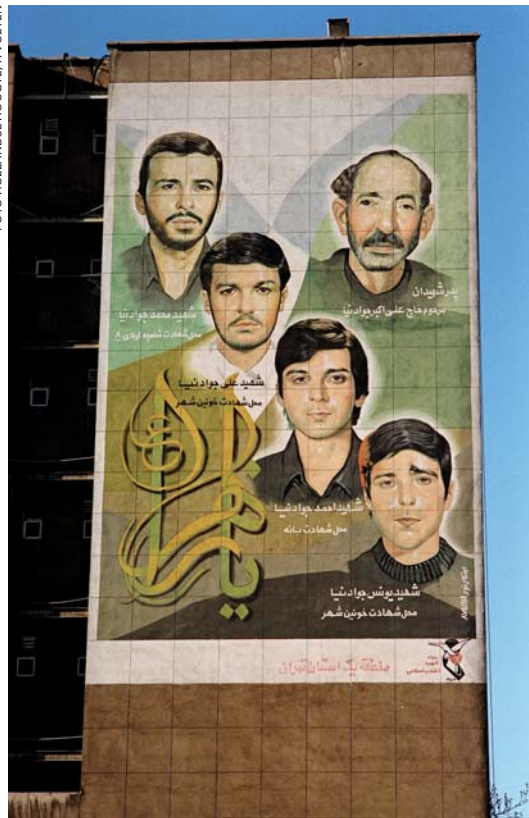
Muurschildering in Teheran van een vader en zijn vier zonen die sneuvelden in de oorlog tegen Irak