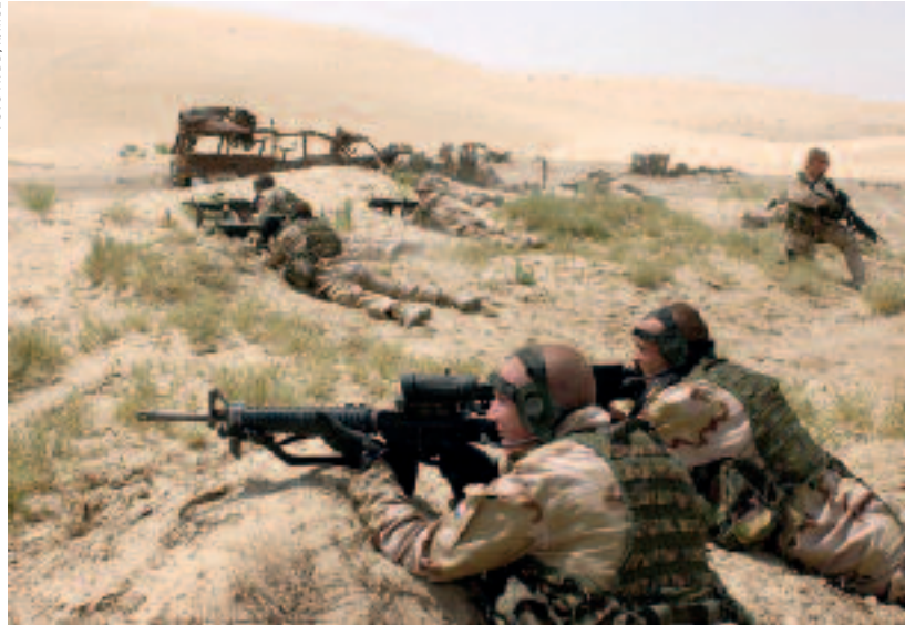
Nederlandse militairen op de schietbaan bij As Samawah, Irak 2004

'Irregulier' is gekoppeld aan oorlogvoeren, dus aan fysiek handelen. 21 Het heeft veel dimensies, onder meer een juridische. Maar de essentie is dat de irreguliere opponent niet vecht tegen onze militaire component voor een militair doel, maar dat de militaire irreguliere strijders vechten voor een politiek doel. Regulier is hierin militair versus militair en politiek versus politiek; irregulier is militair versus politiek. 'Asymmetrisch' is eerder een zaak van het effect van een conflict. Asymmetrisch kan worden afgezet tegen ons beginsel van proportionaliteit. Bijvoorbeeld: de atoombom op Hiroshima is een irreguliere asymmetrische actie omdat het een militaire actie was om een politiek doel te behalen, en de gevolgen van het effect waren buitenproportioneel (naar huidige maatstaven).