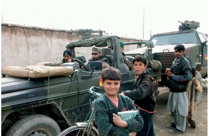
De inwoners van Kabul zijn vertrouwd geraakt met de aanwezigheid van Duitse militairen

is en dat het mogelijk nog vergaande consequenties kan hebben vanwege mogelijke ondersteuning van AWACS aan militaire operaties in Pakistan en Iran. Hij vreest dat Duitsland stap voor stap in een situatie zou kunnen geraken waarvan op dat moment – juni 2008 – de gevolgen nog niet te overzien waren.