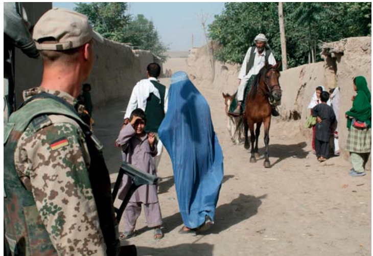
Patrouille van het Duitse PRT in de omgeving van Kunduz

van de Bundeswehr aan internationale militaire operaties: de internationale druk. Het argument van de Bündnisfähigkeit , de verantwoordelijkheid die Duitsland moet nemen om als een betrouwbare partner te gelden, is sterk. Het heeft zeker een belangrijke rol gespeeld in het proces waarbij Duitsland sinds 1990 in toenemende mate bereid bleek deel te nemen aan internationale militaire operaties. Als uitvoerende macht voelt de Bondsregering deze druk eerder dan de Bondsdag, de wetgevende macht.