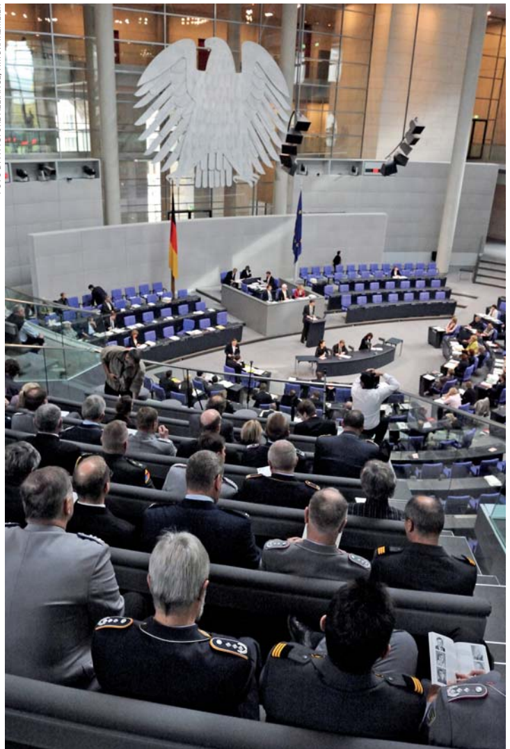
Militairen van de Bundeswehr volgen het debat over de verlenging van de ISAF-missie in de Bondsdag