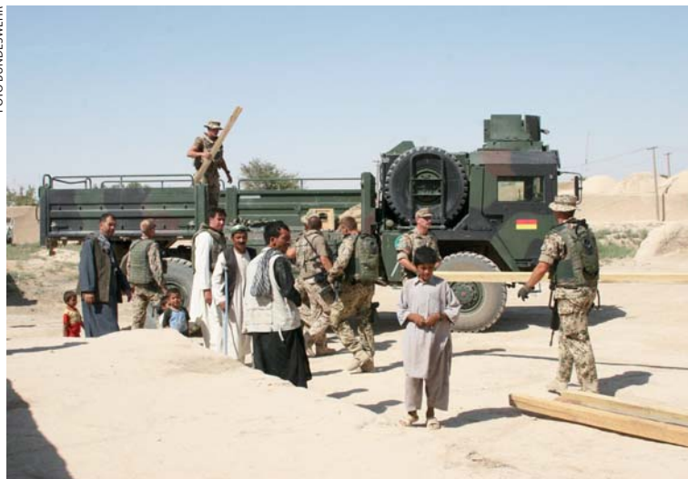
Duitse militairen laden bouwhout voor de plaatselijke bevolking af in Mazar-e-Sharif

in Kandahar. Het gaat om een Duitse eenheid die momenteel deel uitmaakt van een NAVO Verbindingsbataljon en tijdelijk is ingezet op de ISAF-locatie in Kandahar. Voorts is de Duitse bijdrage niet met de gebruikelijke twaalf, maar met veertien maanden verlengd. Ten slotte is in het verlengingsbesluit, zoals gebruikelijk, een financiële paragraaf opgenomen. De Duitse militaire bijdrage is van oktober 2008 tot en met december 2009 begroot op 688 miljoen euro.