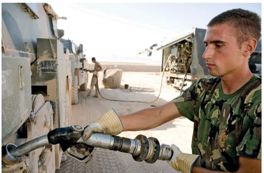
Tarin Kowt, Afghanistan. Mannen van de logistiek zijn bezig met het aftanken van Bushmasters op kamp Holland (2007)