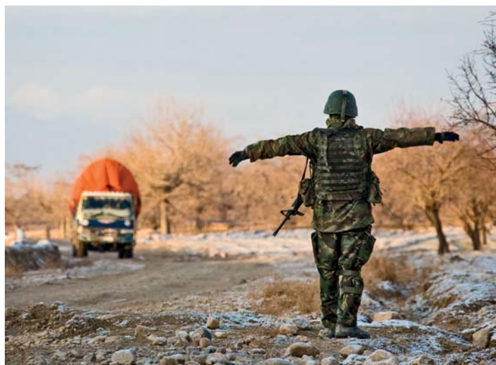
Militaire operaties zijn complex en kennisintensief. Tegenwoordig zijn meer dan ooit 'smart soldiers' vereist

moeten daarnaast ter afsluiting van hun studie een scriptie (ook wel thesis genoemd) schrijven. De invulling van de 'vrije keuze' cursus en de scriptie kan binnen of buiten de gekozen profilering plaatsvinden, maar altijd binnen de aandachtsgebieden van MBW.