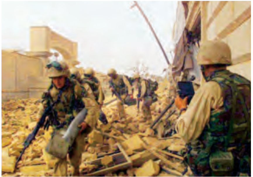
'Urban warfare' is een extreem complexe operatie

Deze teams coördineren, adviseren en coachen tijdens de opleiding van de eenheden en gaan mee met oefeningen en operaties. Commandanten op bataljonsniveau worden op individuele basis begeleid.