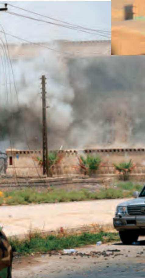
Links: soldaten van de 101st 'Airborne Division' kijken naar de uitwerking van hun aanval (2003)