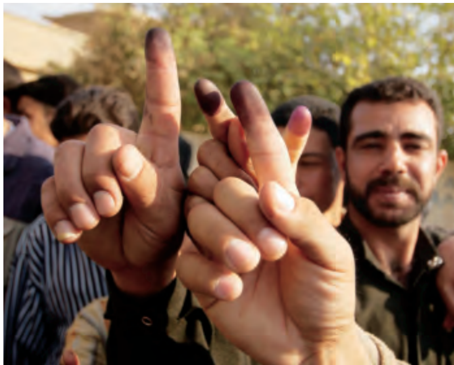
Irakese mannen hebben hun stem uitgebracht tijdens de eerste vrije parlementsverkiezingen in Hayji, Irak (2005)

Alle door Nederland te vullen functies in het hoofdkwartier waren op dat moment al niet meer gevuld, behalve de functie van strategic planner in de Strategy, Plans and Assessments Branch .