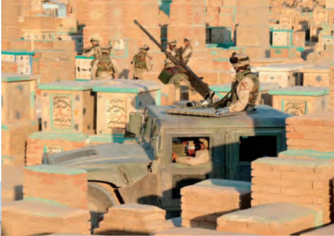
Boven: een Amerikaanse soldaat geeft zijn collega's dekking op een begraafplaats nabij An Najaf, Irak (2004)