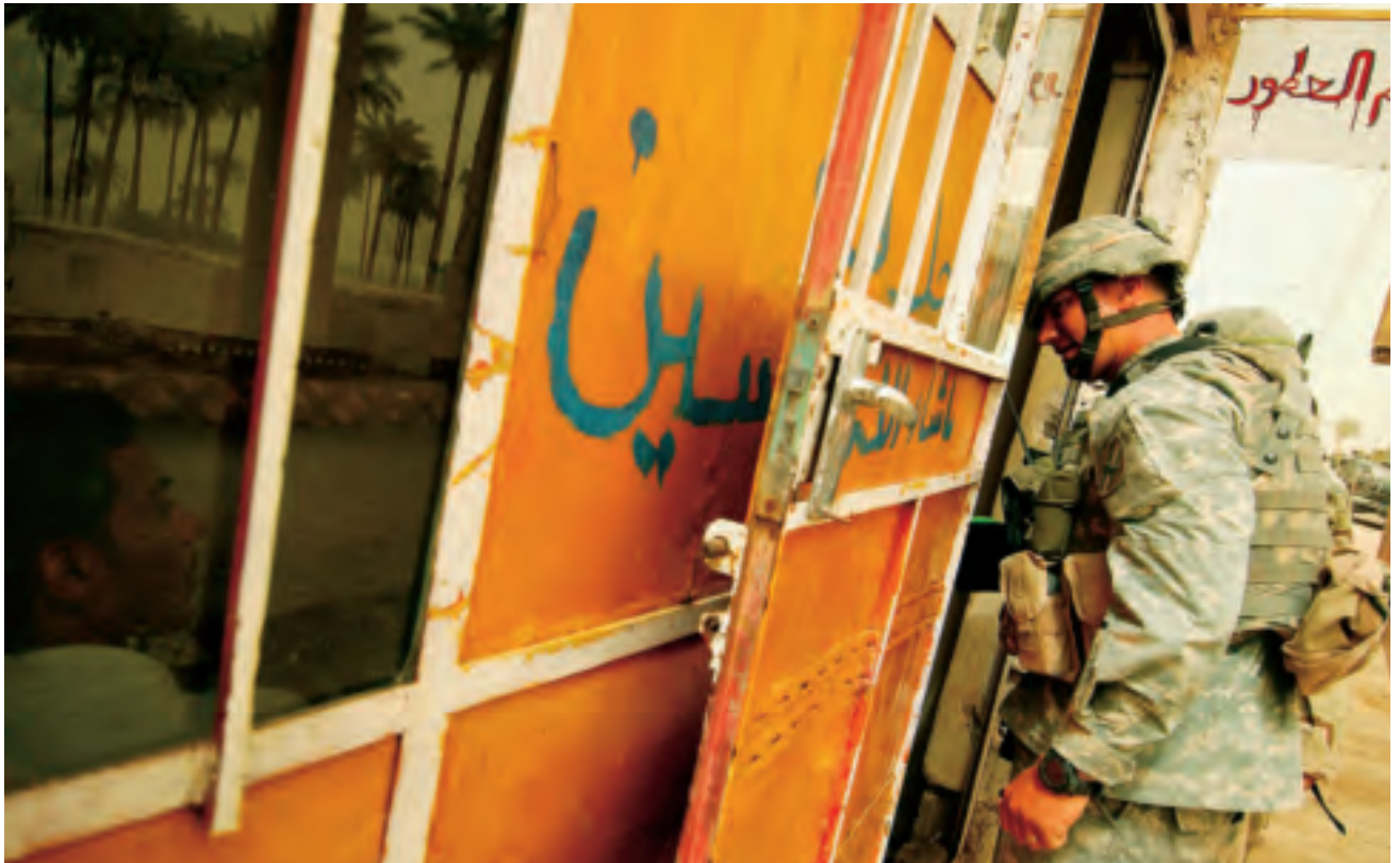
Amerikaanse militair kijkt een winkeltje in om informatie te winnen, Irak, juni 2005