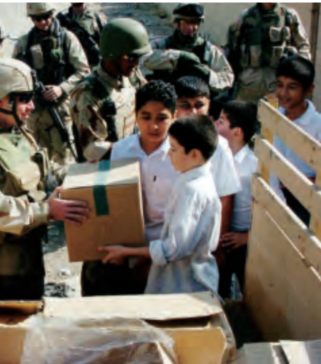
Amerikaanse en Irakese soldaten delen schoolspullen uit aan een lagere school in Bagdad, Irak september 2005