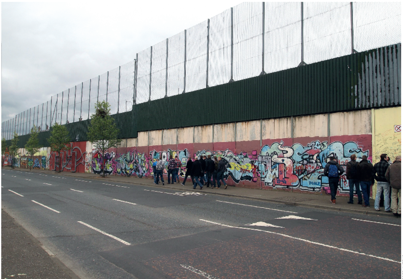
De metershoge scheidingsmuur tussen de beide katholieke en protestantse wijken. Ook het Goede Vrijdag-akkoord laat de politieke toekomst open. Dat kan ook niet anders, omdat de gemeenschappen hierover fundamenteel van mening verschillen