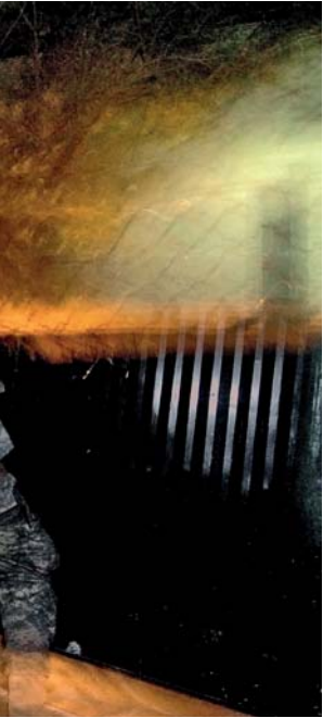
Amerikaanse militairen delen hun operationele ervaringen al geruime tijd via internet

tiefnemers zou leiden tot meer deelnemers, maar de bekendheid van het forum bleef achter bij de verwachting. Om die reden is een roadshow gehouden bij de Operationele Commando's, de Defensiestaf, en de Nederlandse Defensie Academie.