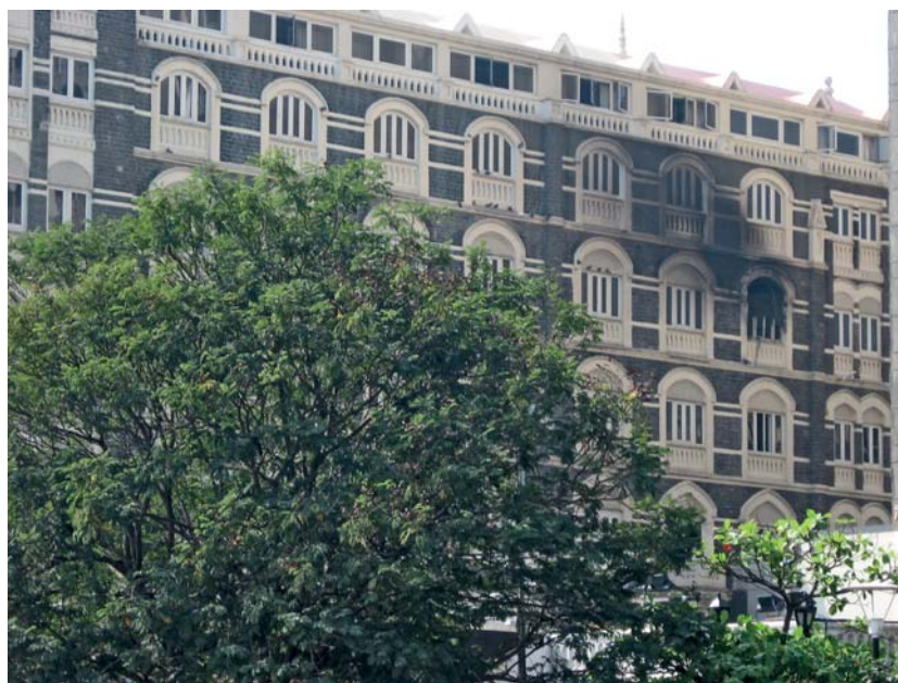
Het Taj Mahal hotel, vlak na de aanslag in november 2008. De uitgebrande kamers zijn duidelijk zichtbaar

Een kras voorbeeld van het laatste – effectief gebruik van Commercial Off The Shelf internet-technologie – vormt de recente aanslag in Mumbai, India 5 : GPS-apparatuur, GSM en PDA's ( Personal Digital Assistant ) ondersteunden de synchronisatie van de swarming manoeuvre van de tien betrokken terroristen naar hun doelen.