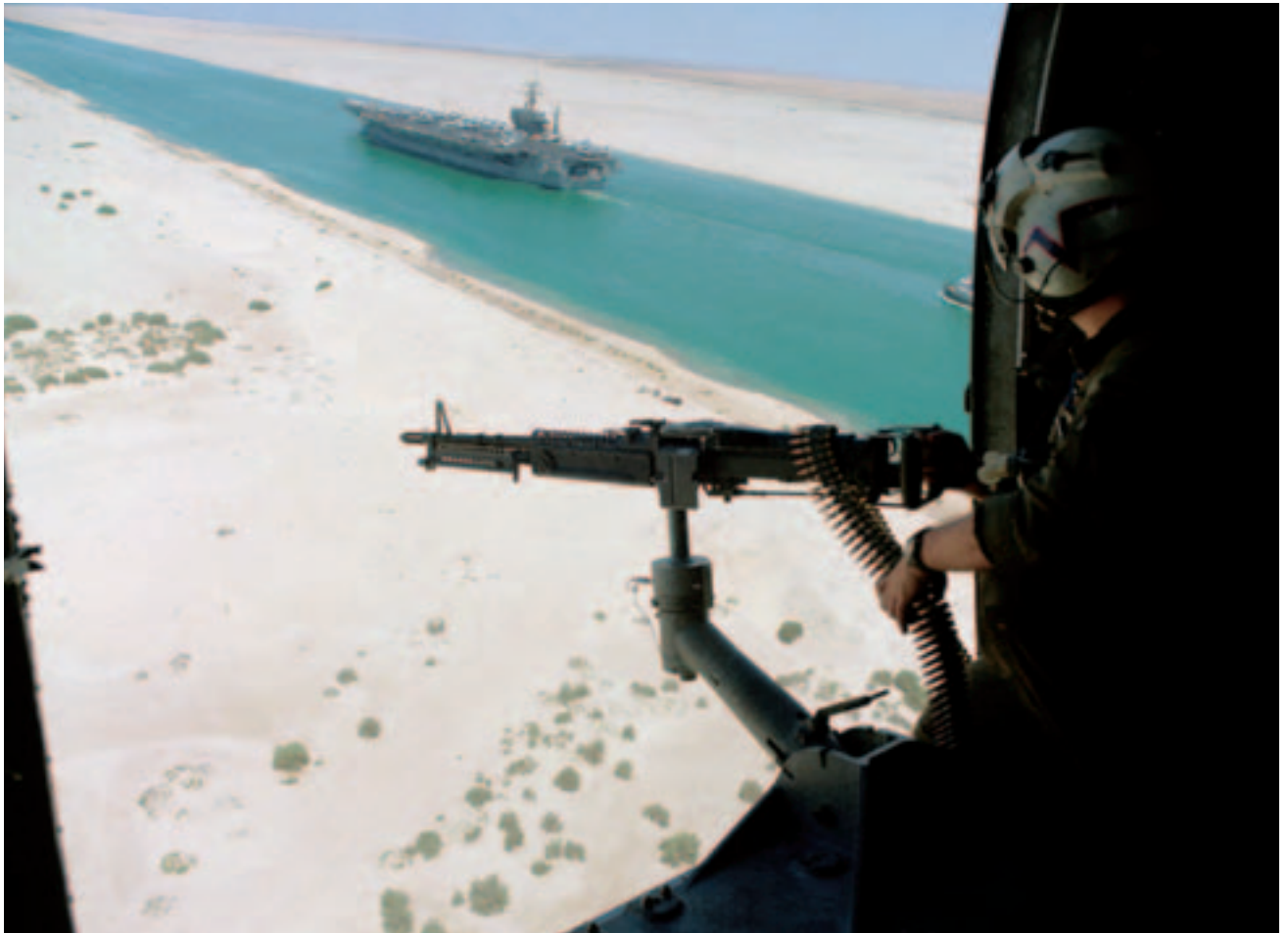
Een boordschutter kijkt vanuit de helikopter neer op het vliegdekschip de USS 'Dwight D. Eisenhower' (CVN-69) dat door het Suez-kanaal vaart in het kader van operatie 'Desert Shield', 1990

De definitie van het begrip 'systeem' blijkt problematisch, ook wanneer de relevante systemen worden teruggebracht tot de categorie strategische actoren. In The enemy as a system hanteert Warden zelfs twee definities. In de hoofdtekst schrijft hij: A strategic entity is anything that can function on its own and is free and able to make decisions as to where it will go and what it will do (Warden 1995, 45). En vervolgens meldt hij in een voet-