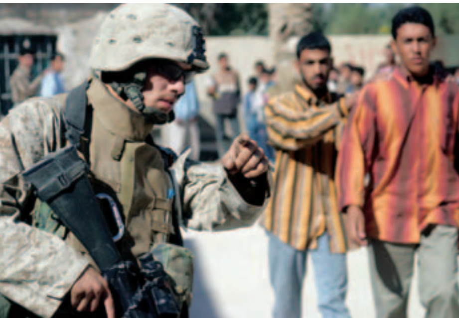
Militairen van 'US Marine Corps' bezoeken een Irakese school op zoek naar informatie over een opstootje tijdens operatie 'Trifecta', onderdeel van operatie 'Iraqi Freedom', 2005