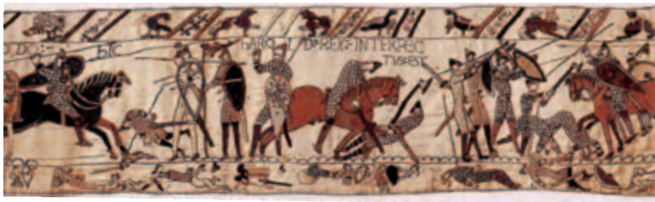
Links: het wandtapijt van Bayeux, dat de Slag bij Hastings voorstelt. Onder: een detail van het wandtapijt

die volgens hem zijn strategisch doel bereikte op het moment dat Harold viel ten gevolge van een Normandische pijl. Dit is onjuist. Het vijandelijke systeem in dit geval was het Engelse koninkrijk; het politieke doel waarover controle moest worden verkregen. Uitschakeling van Harold betekende weliswaar het einde van het grootschalige georganiseerde verzet, maar niet noodzakelijk instemming met Willems koningschap.