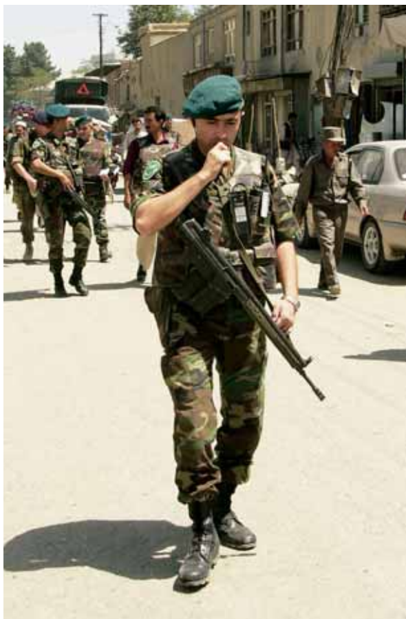
‘Turkse militairen in Kabul werden inderdaad niet aangevallen, in tegenstelling tot westerse troepen...’ Afghanistan, 2003

andere collega’s met de bedoelde kenmerken, en die noemde weer andere namen.