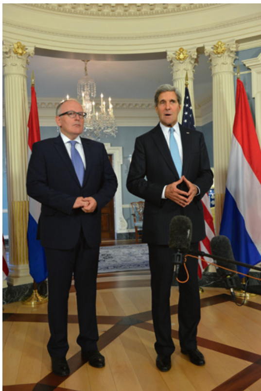
Toenmalig minister van Buitenlandse Zaken Frans Timmermans (links) tijdens een bilaterale bijeenkomst in de VS, september 2013. Timmermans verzocht de Commissie van Advies inzake Volkenrechtelijke Vraagstukken een advies uit te brengen over de legitimiteit van de inzet van 'bewapende drones'

van het aanvallen van leden van georganiseerde gewapende groepen in NIGC. De commissie stelt dat zij, naast leden van de krijgsmacht van de staat die de gewapende groepering bestrijdt, legitieme militaire doelwitten vormen, mits zij een doorlopende gevechtsfunctie voor de gewapende groep uitoefenen. De commissie neemt hiermee het uitgangspunt van het ICRC over. 35