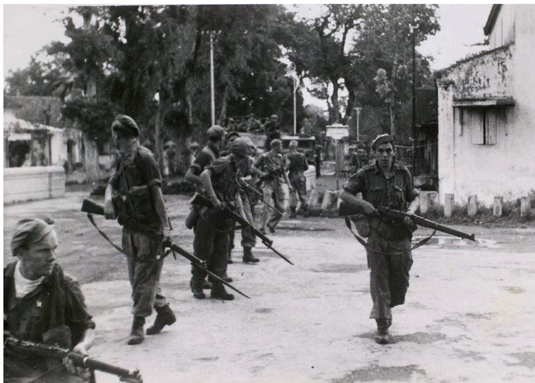
Gespannen Nederlandse militairen patrouilleren door Solo

In enkele regio's waar de Nederlandse militaire aanwezigheid tot een minimum was teruggebracht, moesten voortaan slecht uitgeruste en opgeleide hulptroepen, waaronder veiligheidsbataljons, ondernemingswachten of politiemensen, dit vacuüm zien op te vullen. Het afschuiven van taken naar grotendeels autochtone en onvoldoende toegeruste hulptroepen mondde regelmatig uit in extreem geweld, mede omdat de opstandelingen liever deze eenheden aanvielen dan de in het open gevecht superieure Nederlandse militairen. Hieruit blijkt opnieuw dat het troepentekort en alle negatieve gevolgen daarvan belangrijke oorzaken waren voor het ontstaan van extreem geweld.