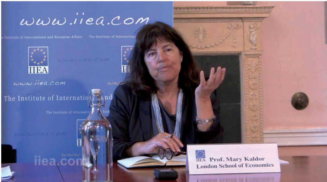
Traditionele grenzen tussen oorlog, georganiseerde criminaliteit en schendingen van mensenrechten vervagen, aldus wetenschapper Mary Kaldor

waarop terroristische organisaties criminele activiteiten ontplooiën. Hierbij staat de volgende vraag centraal: in welke mate is Hezbollah betrokken bij georganiseerde criminaliteit? Het artikel bestaat uit drie delen. Eerst behandel ik een theoretisch raamwerk over de relatie tussen criminaliteit en terrorisme. Ten tweede behandel ik de casus Hezbollah, waarbij een algemene beschrijving van de organisatie en de criminele activiteiten die Hezbollah ontplooit in Noord- en Zuid-Amerika aan bod komen. Criminele activiteiten dienen voor veel terroristische organisaties als belangrijke inkomstenbron, maar bijvoorbeeld ook als logistieke ondersteuning voor terroristische activiteiten of als pressiemiddel ten opzichte van de plaatselijke bevolking. 5