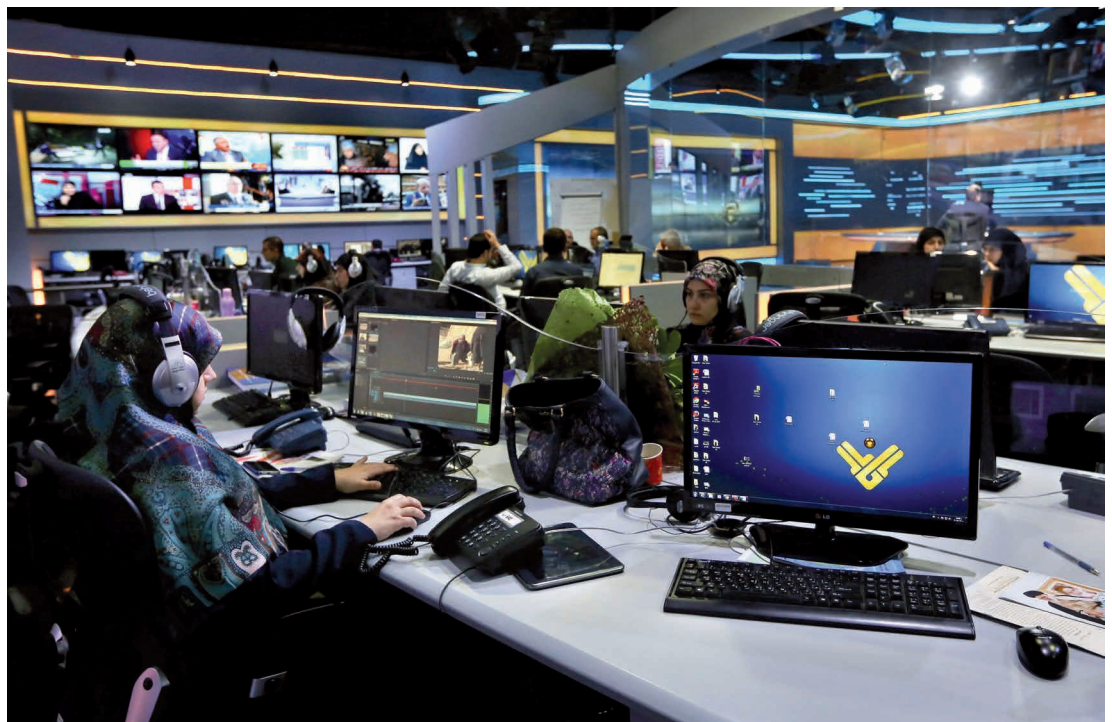
Journalisten in de newsroom van Hezbollah's tv-station Al-Manar, Beiroet, Libanon