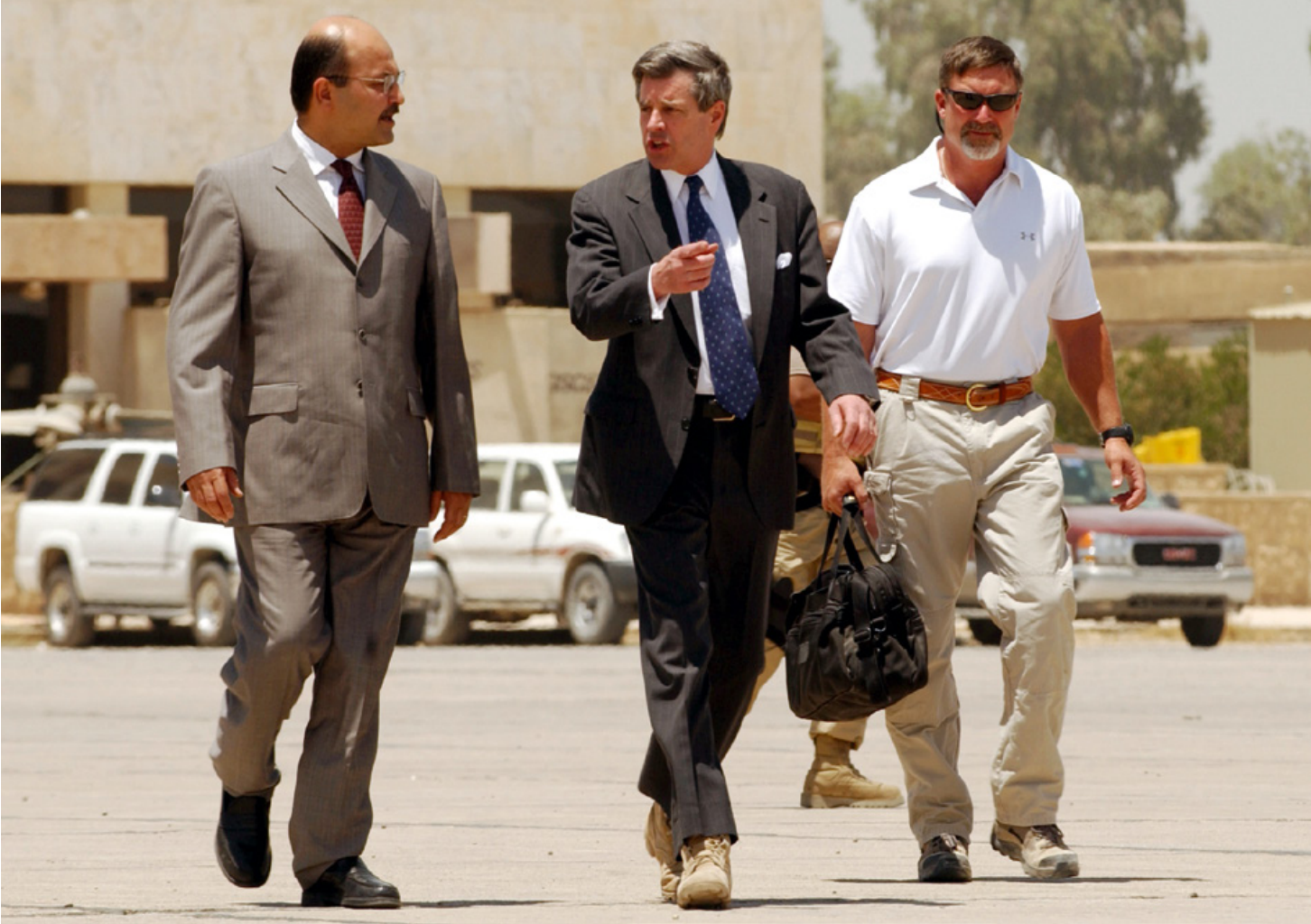
De speciale VS-gezant voor Irak Paul Bremer (m.) begon in 2003 met de deba'athificatie van de Iraakse politiek en het ontslag van alle voormalige onder Saddam Hoessein dienende militairen