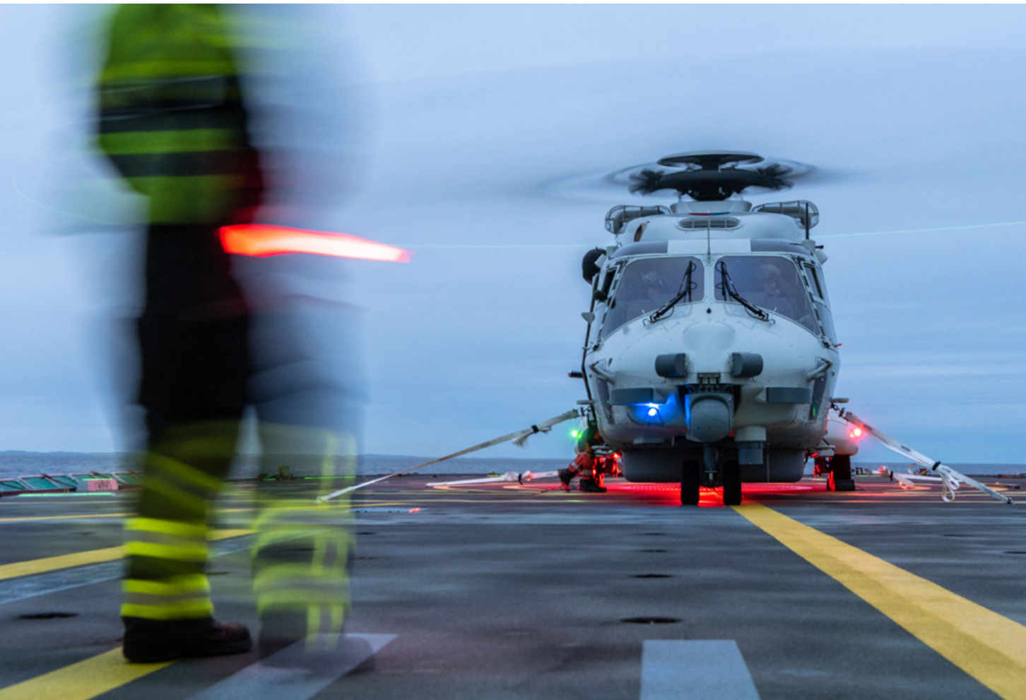
Een Nederlandse NH90-helikopter landt op het Deense support ship Esbern Snare: Trident Juncture 2018 was bedoeld om grootschalige gevechtsoperaties te trainen en te evalueren