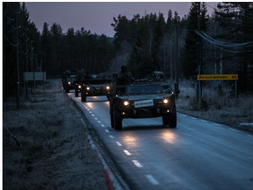
Om de planning van strategische verplaatsingen te verbeteren, moet er in Nederland eenheid van opvatting komen op het gebied van internationale documenten en kennis van de te gebruiken systemen binnen de NAVO

Internationaal samengesteld oefenen en opereren is alleen mogelijk als gebruik wordt gemaakt van dezelfde, regelmatig beoefende procedures. Zoals eerder in gezegd is de interoperabiliteit op het gebied van verbindingssystemen niet optimaal, wat een negatieve invloed heeft op de militaire operatie. Niet goed werkende systemen zorgen voor vertraging en onduidelijkheid tussen commandanten. Technologie, procedures en standaarden moeten internationaal worden