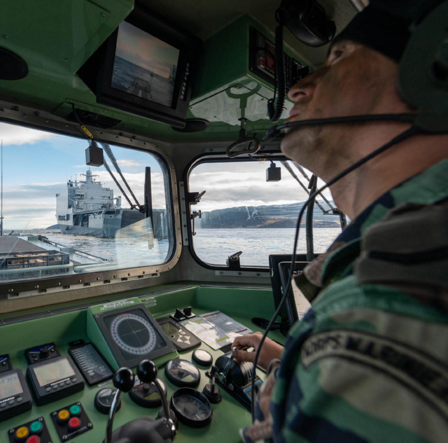
Trident Juncture 2018 resulteerde in een effectieve amfibische training in het opwerken naar inzetgereedheid voor de NATO Response Force in 2020

De landmacht trainde gevechtsoperaties met een samengestelde bataljonstaakgroep onder leiding van de door Duitsland geleide multinationale Very High Readiness Joint Task Force 2019-brigade. Het tactische scenario speelde zich deels buiten de militaire oefenterreinen af, wat invloed had op de tactieken van de landeenheden. Het Noorse landschap is bergachtig met smalle dalen en weinig wegen en dat beïnvloedde de uitvoering van grootschalige gevechtsoperaties. Het oefenen in ander terrein dan bijvoorbeeld