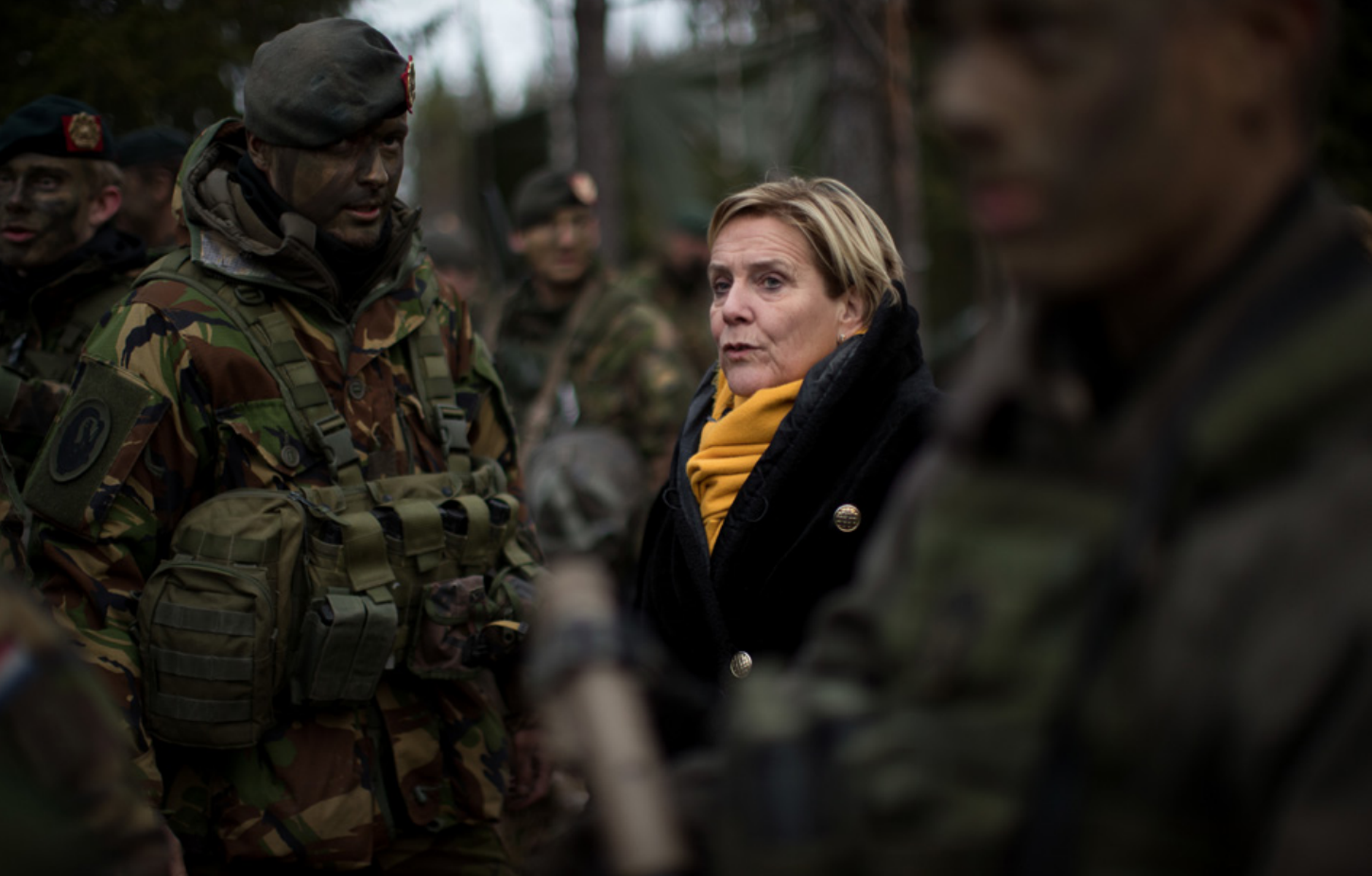
Net als vertegenwoordigers van Nederlandse media stelde minister van Defensie Bijleveld zich persoonlijk op de hoogte van het verloop van Trident Juncture 2018