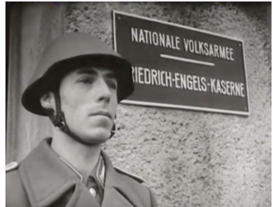
Of een NVA-militair door kon groeien tot attaché hing onder meer af van zijn trouw aan de partij en zijn geloof in de theorieën van communistische denkers

Vanuit de NVA werden de eerste militair attachés van de DDR gerekruteerd. De minister van Defensie benoemde hen, nadat de geselecteerde officieren door het Centrale Comité van de SED waren gescreend en betrouwbaar bevonden. Sinds 1961 volgde de benoeming van de militair attachés door de ministerraad van de DDR, maar waren ze alleen ondergeschikt aan de minister van Defensie. Vanaf 1975