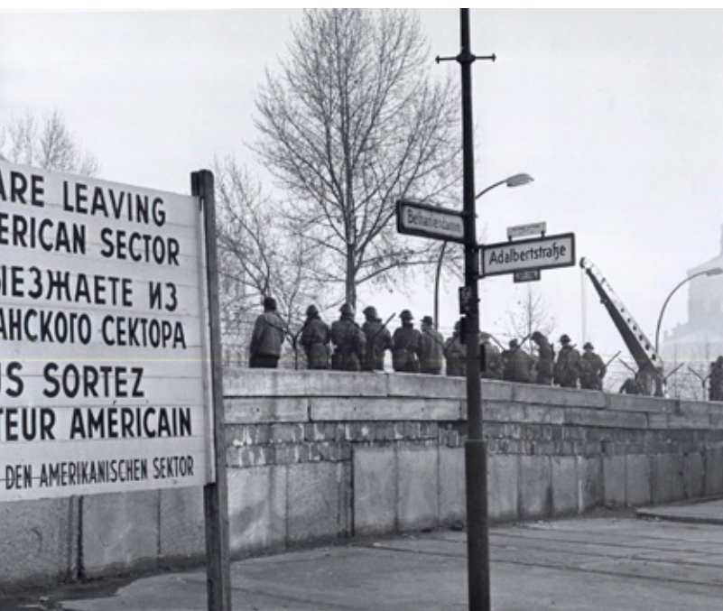
De NVA had formeel als taak het beschermen van het DDR-grondgebied, terwijl de militaire inlichtingendienst het vijandbeeld van de 'agressieve' NAVO en de 'imperialistische' Bondsrepubliek benadrukte

In de korte tijd van haar bestaan (1949-1990) heeft de Duitse Democratische Republiek (DDR) krampachtig gezocht naar internationale erkenning. De communistische staat, waar de Nomenklatoera de touwtjes strak in handen had, kreeg die erkenning in 1973. 1 De DDR is toen zeer actief geweest in het oprichten van ambassades in westerse landen. In navolging van vele landen detacheerde de DDR daarbij ook militair attachés. Hoe bouwden de Oost-Duitse machthebbers dit instituut op en hoe zagen de opleidingen en taken eruit? Wat was de relatie met het ministerie voor Staatsveiligheid? En voor welke problemen staan onderzoekers, die willen achterhalen of de militair attachés invloed hadden op het beleid van de DDR?